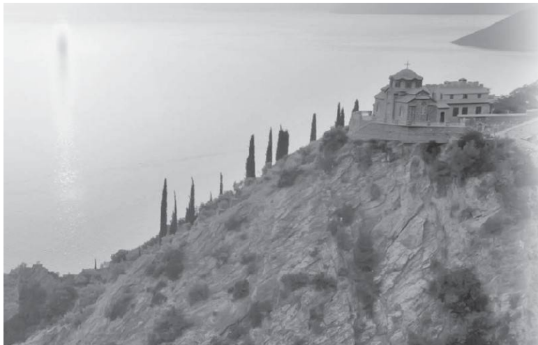
Келья в скиту святой Анны. Афон