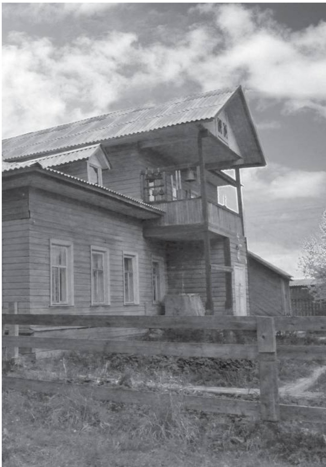
Домовый храм в память праведного Иоанна Кронштадтского на родине святого

• С самого раннего детства, как только я помню себя, лет четырех или пяти, а может быть и менее, родители приучили меня к молитве и своим религиозным настроением сделали из меня религиозно-настроенного мальчика».