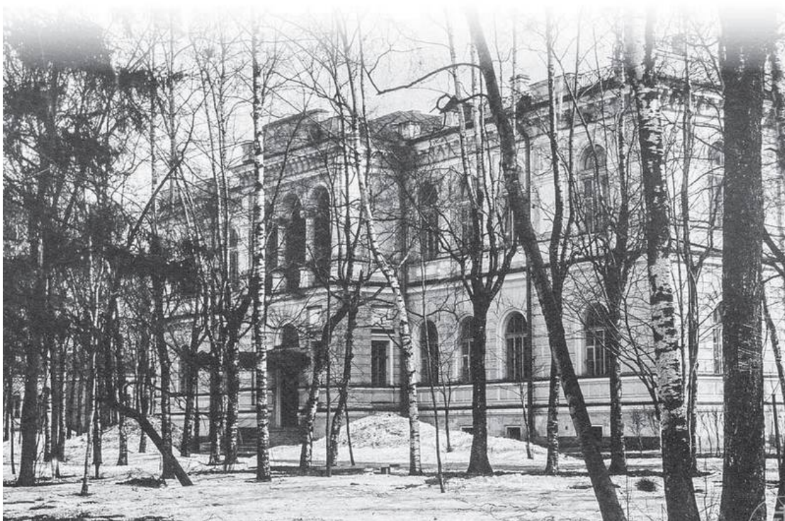
Петербургская духовная академия

• Когда мальчику исполнилось девять лет, отец, собрав последние крохи, отвез его в Архангельское приходское училище. Трудно давалась ему грамота, из-за чего он сильно скорбел. В один из таких тяжелых моментов, в глубокую полночь, когда все спали, он встал и начал молиться особенно горячо. Господь услышал молитву: Божественная благодать осенила мальчика, и, по его собственному выражению, «мгновенно как бы завеса спала с его глаз». В 1851 году Иоанн Сергиев окончил семинарию с отличием и поступил в Петербургскую духовную академию.