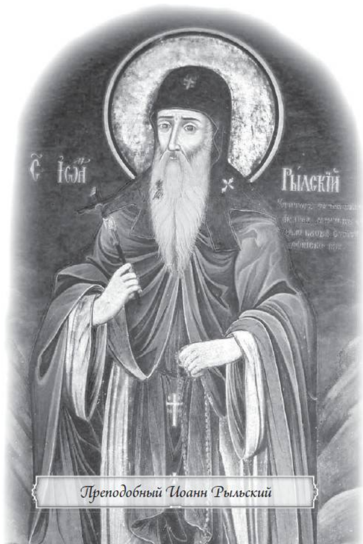
Преподобный Иоанн Рыльский