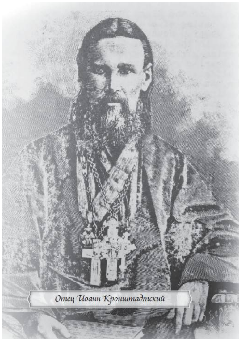
Отец Иоанн Кронштадтский