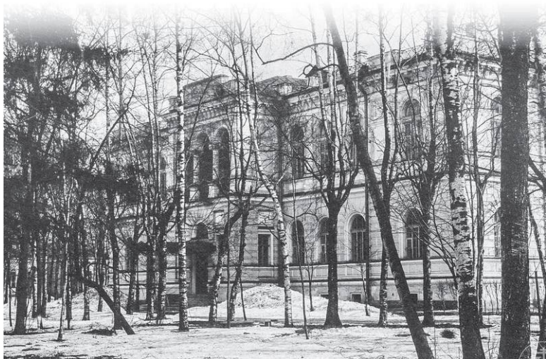
Петербургская духовная академия