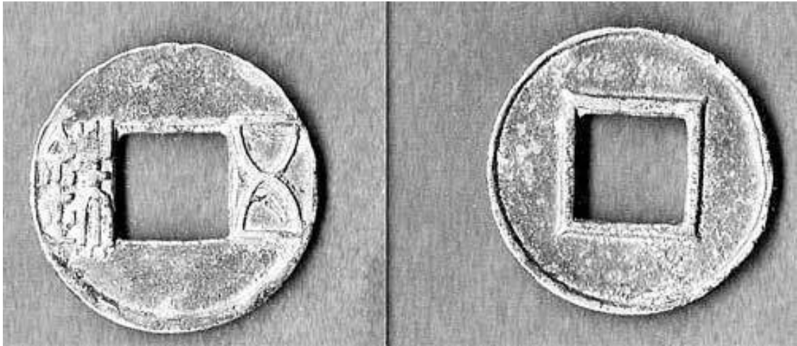
Медная ханьская монета в 5 шу 14 времен правления императора У-ди, покорителя Древнего Чосона