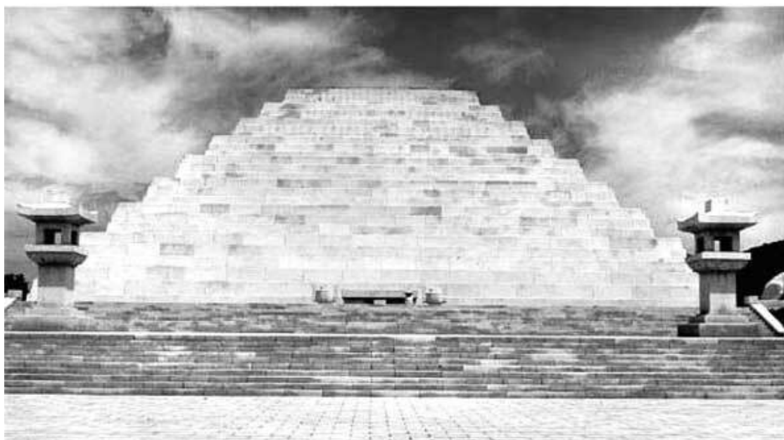
Мавзолей якобы Тангуна

Если же отстраниться от мифа, то образование Чосона состоялось примерно в середине I тысячелетия до н. э. Об этом свидетельствуют скудные данные, содержащиеся в китайских исторических хрониках, и археологические находки.