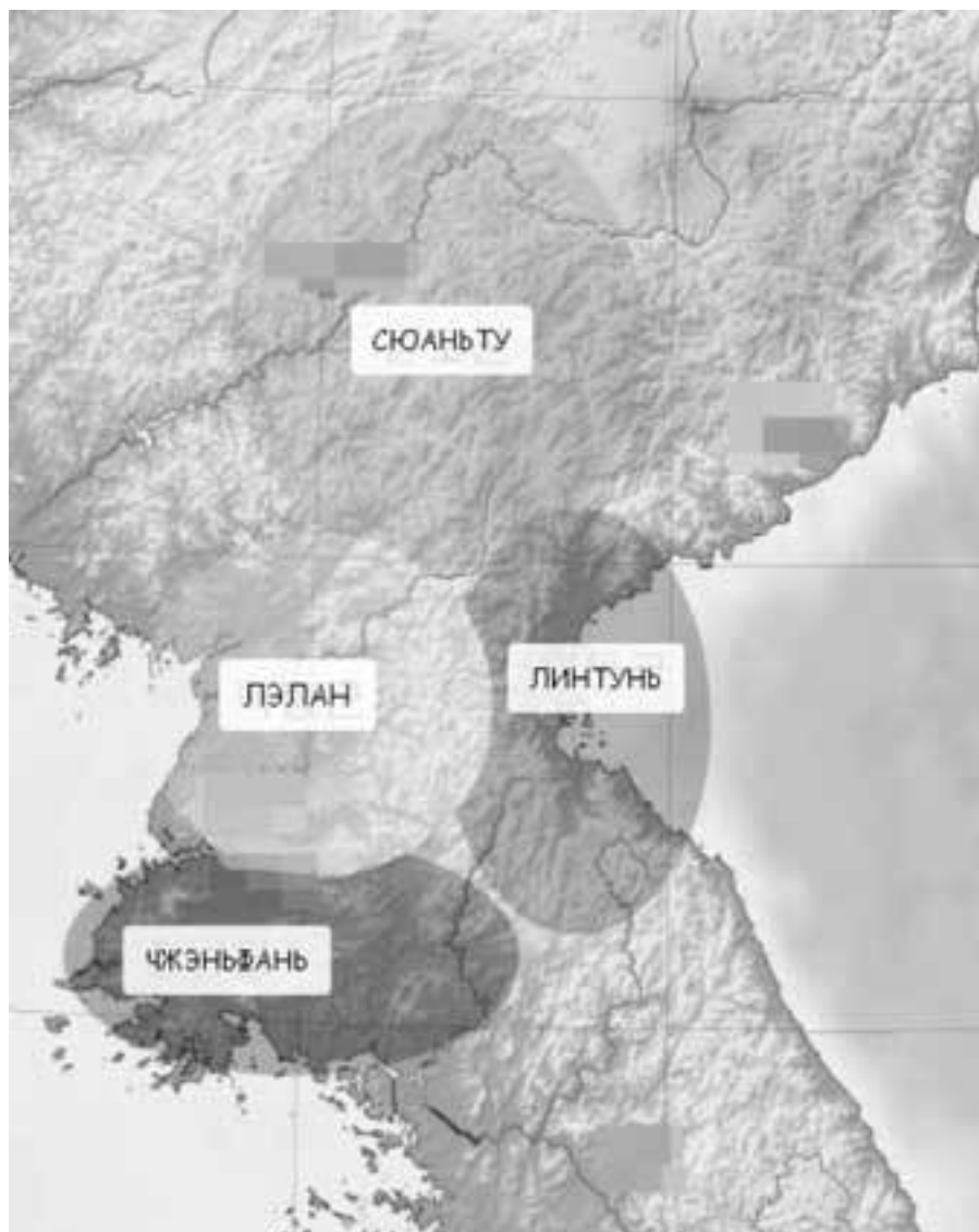
Четыре ханьских округа на территории Древнего Чосона

Первое государство Корейского полуострова дало название последней правящей корейской династии и современному условно коммунистическому государству, расположенному на севере полуострова. Интересное совпадение – точно так же династия Хань, присоединившая к себе чосонские земли, дала название китайской нации 12 .