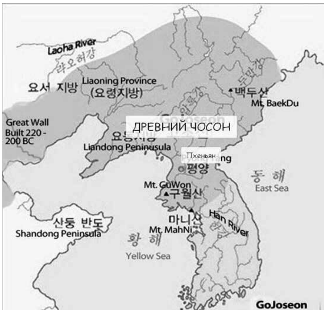
Территория Древнего Чосона (на карте объединены разные периоды)

Если разные мнения имеют документальное подтверждение, то их надо объединить в одно. В результате войн с соседним китайским княжеством Янь территория Древнего Чосона уменьшилась, а его столица переместилась в северную часть Корейского полуострова, на то место, где находится современный Пхеньян.