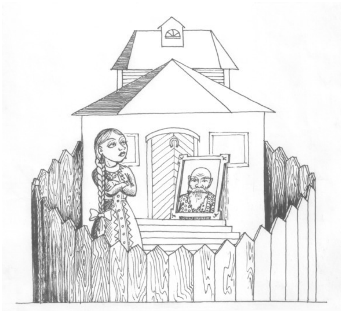
Прием «Поставить забор»