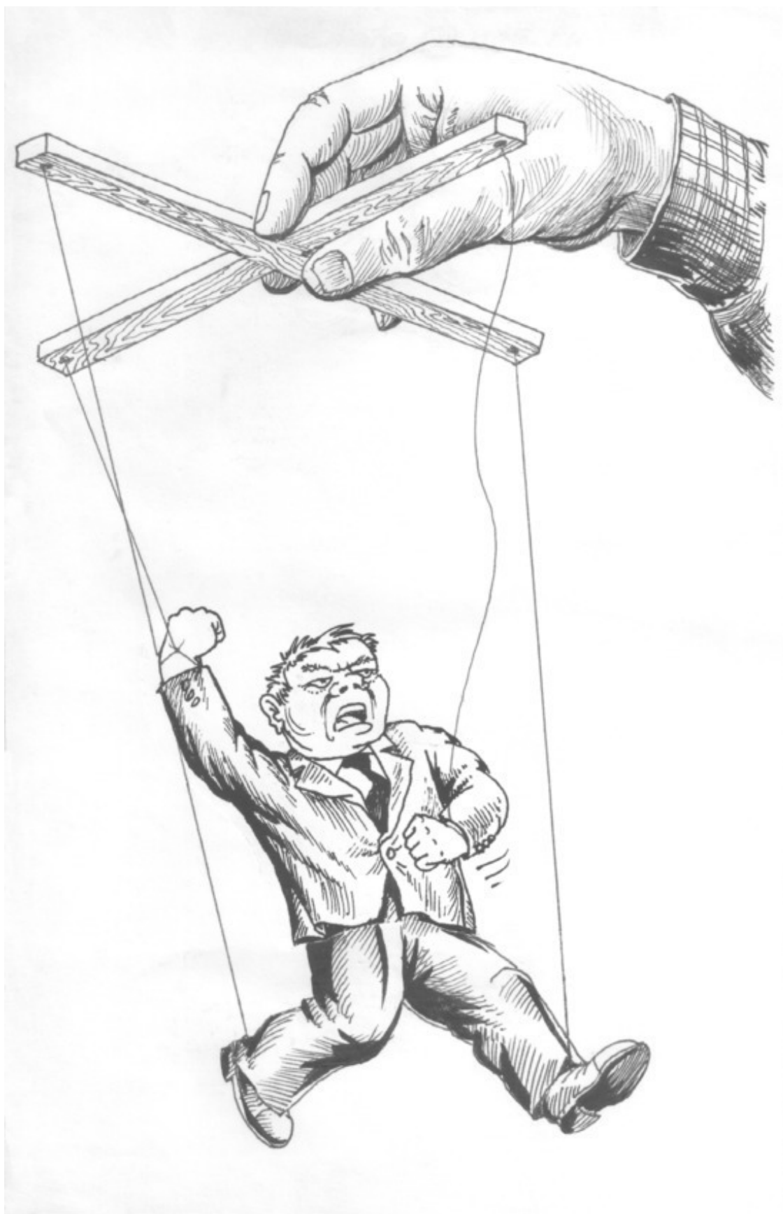
Прием «Поставить над агрессором начальника»