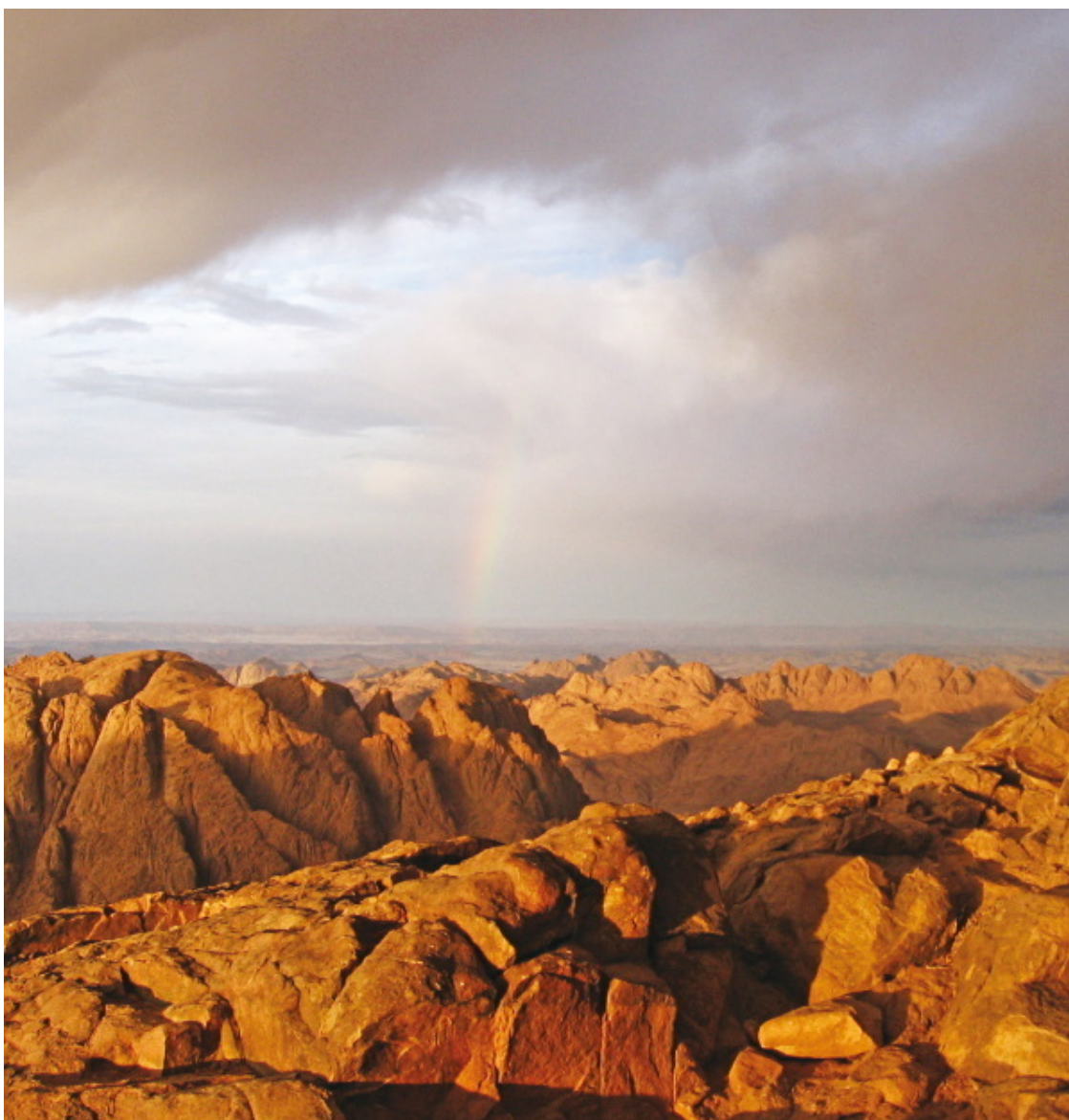
Вид с вершины горы Моисея (Синай).

Если для того, чтобы получить помощь от Бога, достаточно возвести очи к горам, то для того, чтобы встретиться с Богом, необходимо подняться на гору. Нередко Бог назначает человеку свидание не где-нибудь, а именно на горе.