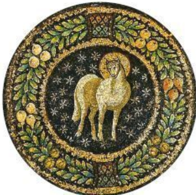
ИЛЛЮСТРАЦИЯ НА ОБЛОЖКЕ:

РЕКОМЕНДОВАНО К ПУБЛИКАЦИИ ИЗДАТЕЛЬСКИМ СОВЕТОМ РУССКОЙ ПРАВОСЛАВНОЙ ЦЕРКВИ (ИС Р19-930-3455)