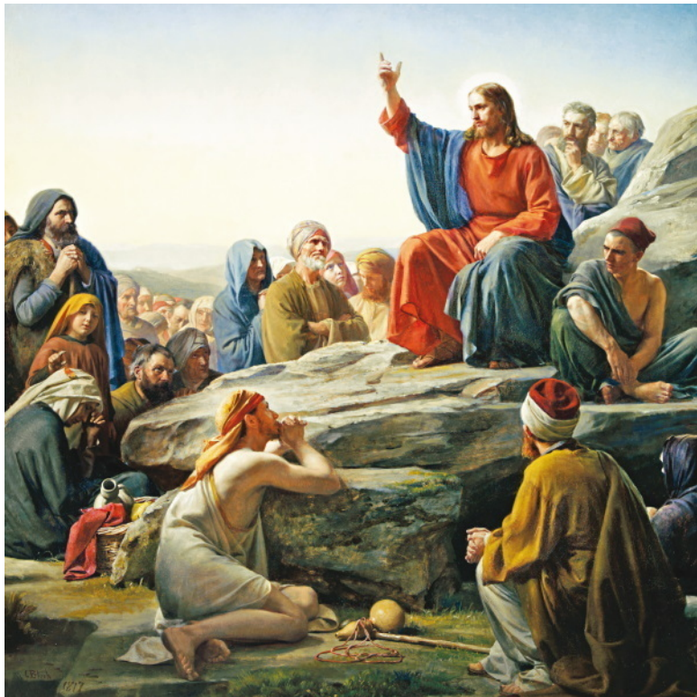
К.Г. Блох. «Нагорная проповедь». 1877 г. Датский музей национальной истории, Фредериксбург.

В Нагорной проповеди Иисус предстает перед читателем, прежде всего, как Учитель нравственности. Однако Он отличается от обычных учителей, чья миссия заканчивается после того, как ученики усвоили урок. Иисус как личность