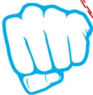
Рис. 10. Упражнение «Возьми себя в руки»