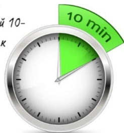
Рис. 9. Упражнение «10 минут отсрочки импульса»

Прокрастинируйте свои импульсивные желания. Делайте то, что хочется сейчас, через 10 мин. Это время, меняющее наши взгляды на удовольствие. Когда удовлетворение происходит с вынужденной 10- минутной задержкой, мозг воспринимает его как отсроченное. Моментальное наслаждение не получается, мощный биологический импульс снижается, наши приоритеты снижаются. (Макгонигал, «Сила воли»)