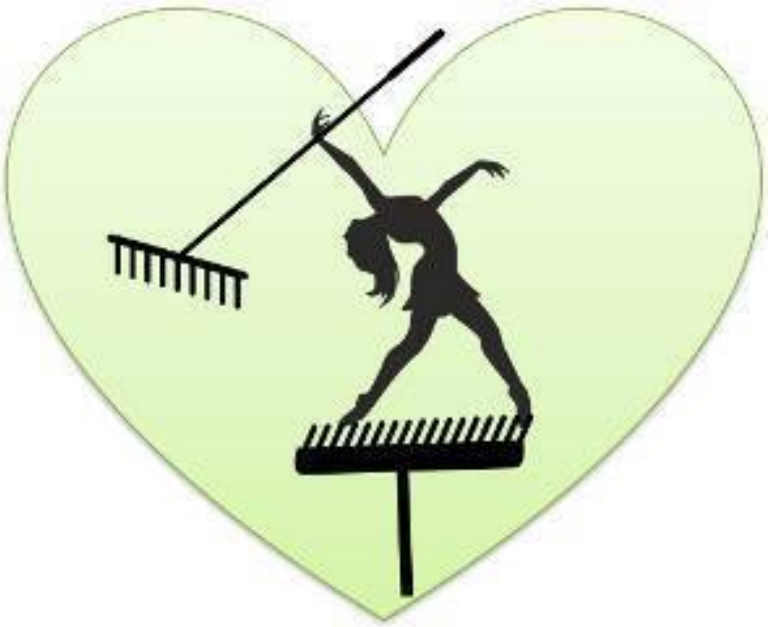
Рис. 8. «Привет, грабли!»

Американский психиатр, психолог и поведенческий экономист Джордж Аинсли 11 считает, что люди избегают выполнения какой-то деятельности в зависимости от частоты подкрепления. То есть считают, что лучше получить поощрение за краткосрочную активность, чем долгосрочное вопло-