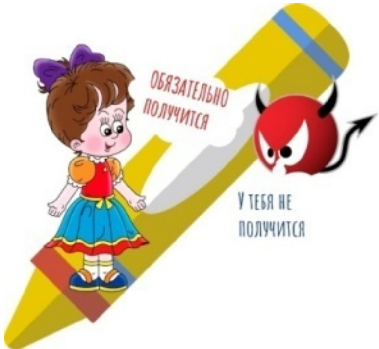
Рис. 6. Работа с внутренним критиком

Всё, больше этот критикан вас доставать не будет.