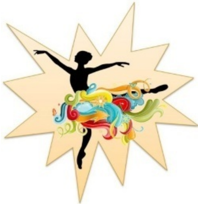
Рис. 4. Творческий хаос рождает танцующую звезду

Но вернёмся к защитам. Второй возможный компенсаторный механизм, ставший результатом постоянных требований родителей стремиться к идеалу, это перфекционизм. Широко известна «перфекционистская ловушка» прокрастинатора или «паралич перфекциониста» – состояние, при