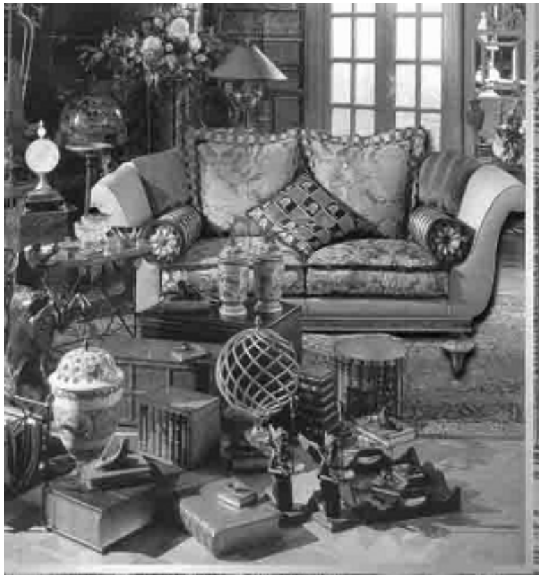
Рис. Различные предметы интерьера «под старину».