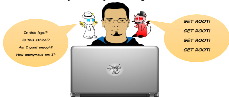
Figure 1 - Le dilemme du hacker

courante pour les débutants est de surestimer leur niveau d'anonymat. Une erreur encore plus grave est de surestimer son niveau de compétence. Une attaque mal exécutée peut révéler l'identité du hacker ou causer des dommages involontaires ou la perte de données dans un système cible. Il faut du temps pour atteindre un niveau de compétence approprié pour n'importe quelle tâche, et l'impatience peut tout gâcher.