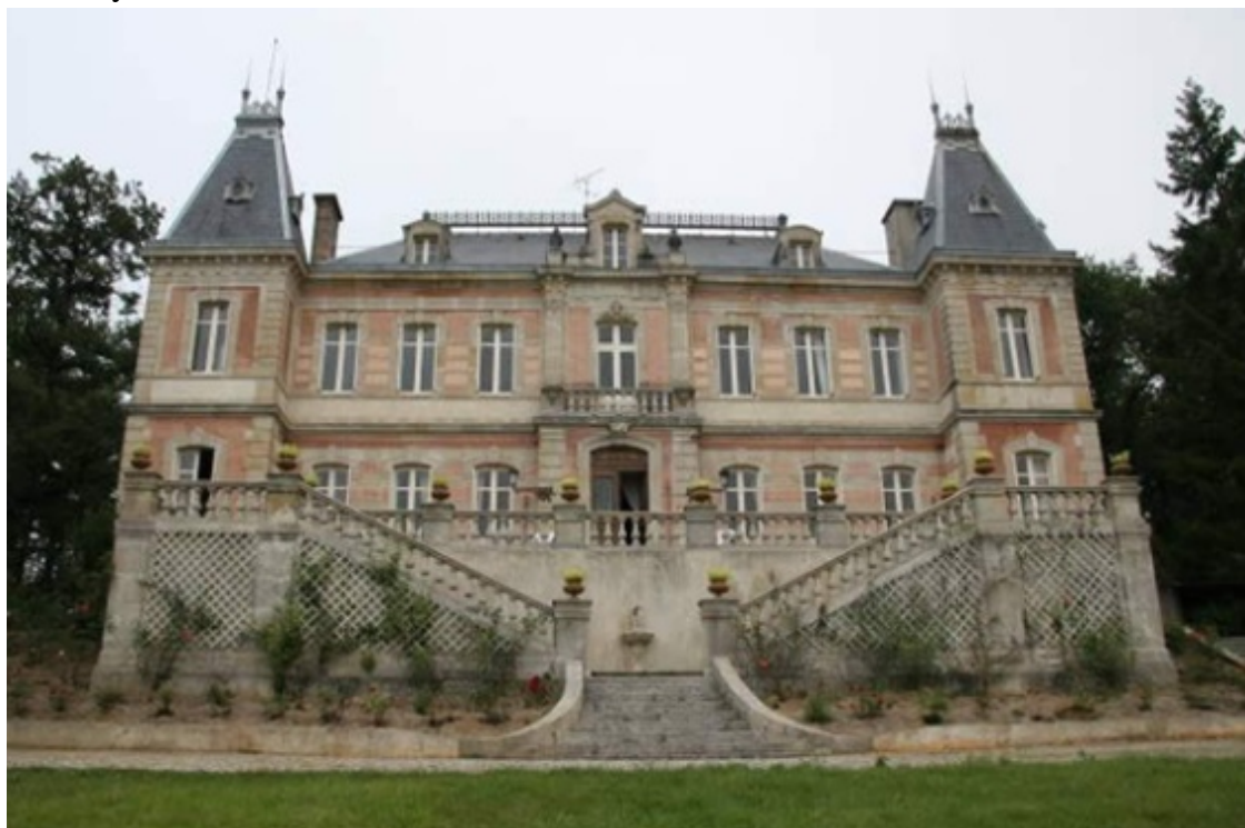
Замок Лорана Белькура

Временно удовлетворив свои сексуальные желания, Белькур сел на частный самолет и улетел в свой замок в Провансе. Правительство конфисковало поместье, когда они впервые арестовали его, но теперь он мог использовать дом, ожидая оформления документов, возвращающих ему собственность.