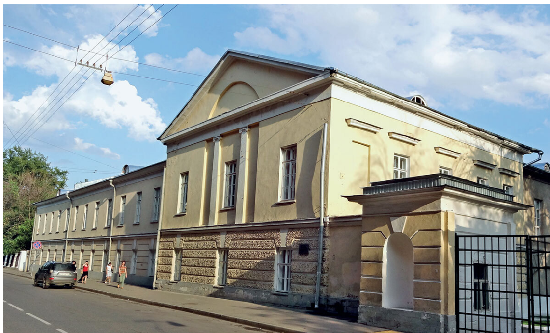
Флигель дворца на ул. Казакова