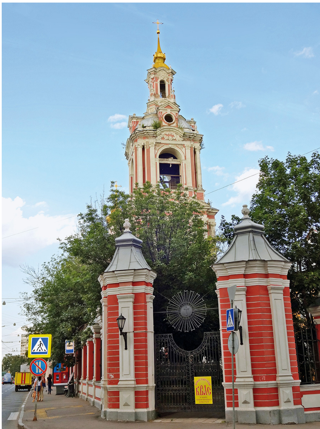
Храм Никиты Мученика

Странно, но Басманная слобода фактически никогда не вписывалась в туристические маршруты. Между тем в центральной ее части – огромное количество памятников истории и архитектуры. Про храм мы вам рассказали. Перейдем по пешеходному переходу на противоположную сторону улицы. Видите дом с резными окнами? Дом № 15 – усадьба Голицыных , построенная в XVIII веке на основе Путевого дворца Василия III. За ним с 1920 года находится единственный зеленый уголок в округе – сад им. Баумана . Под этим революционным названием сад существует до сих пор. Очень приятное место: концертная площадка, похожая на ту,