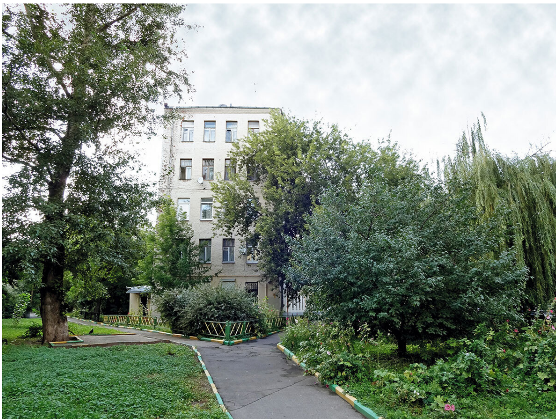
Дворики Гороховского переулка

Храм закрыли в 1930 году. Помещение отдали сначала детскому театру, затем швейной фабрике.