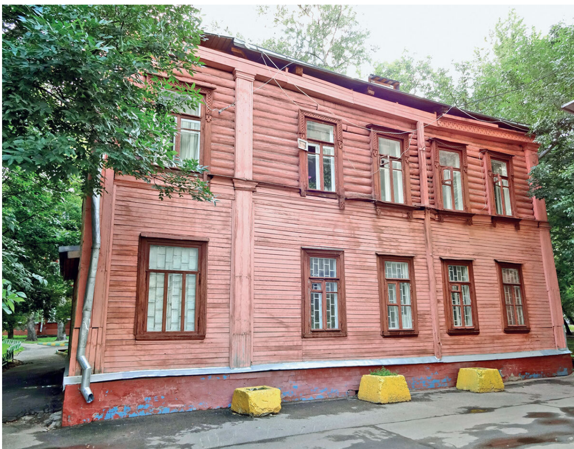
Старая постройка – неофициальный памятник истории