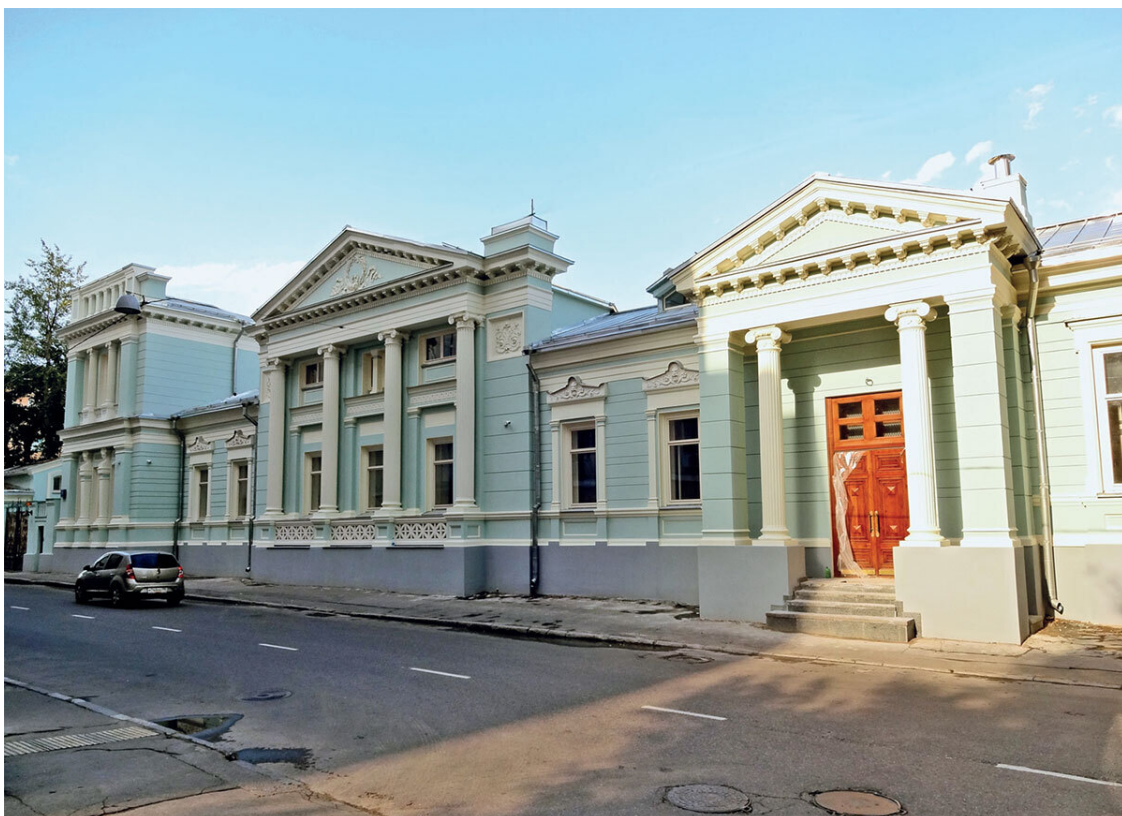
Асимметричный особняк Прове