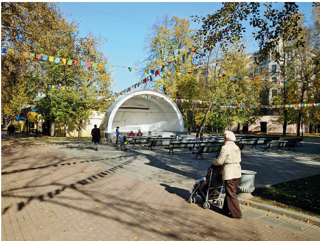
Осень в парке