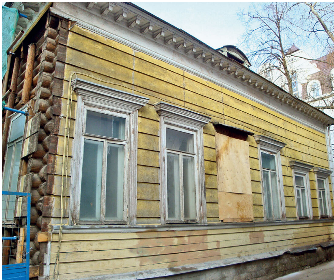
Здесь был Пушкин

На пару минут стоит свернуть на улицу, названную в честь военного летчика Александра Лукьянова. Пройдем мимо крайне неудачного здания Института инженерной экологии в сторону еще одного старинного особняка (№ 7).