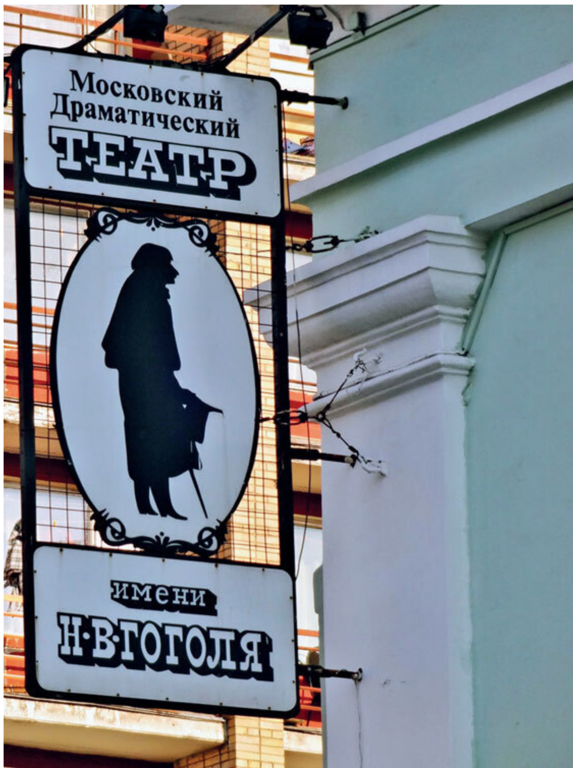
Театр им. Гоголя