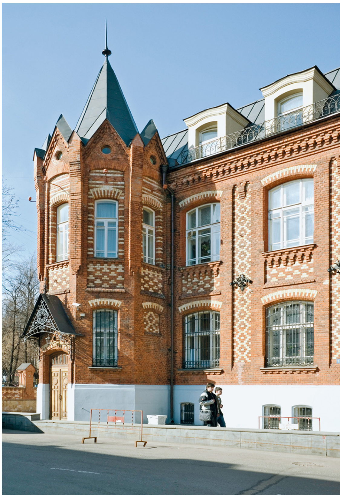
Английский замок. Или Школа акварели