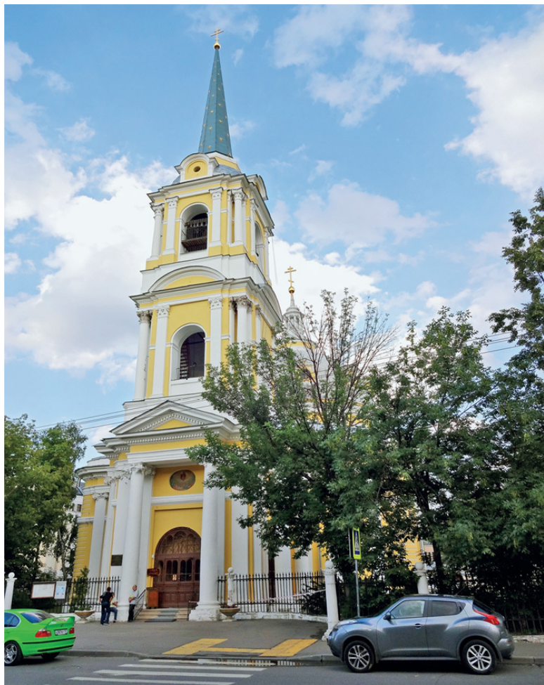
Храм Вознесения на Гороховом поле