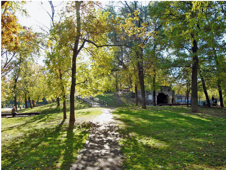
Сад имени Баумана