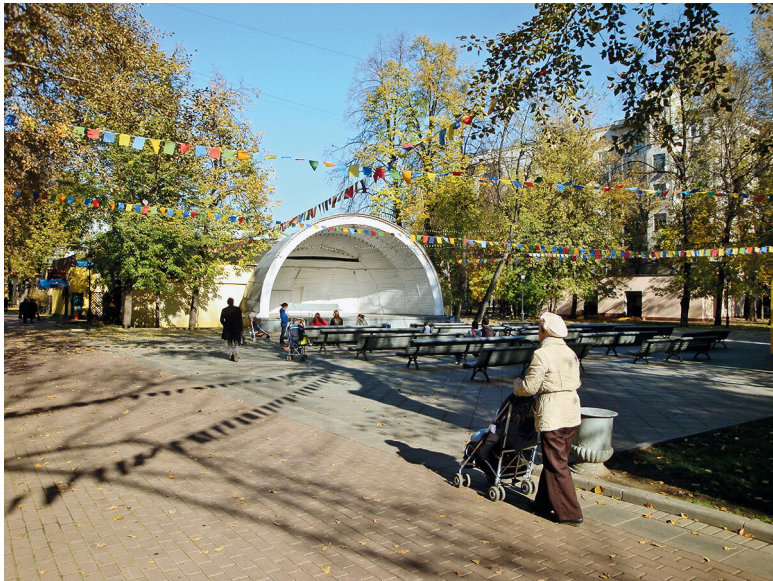
Осень в парке