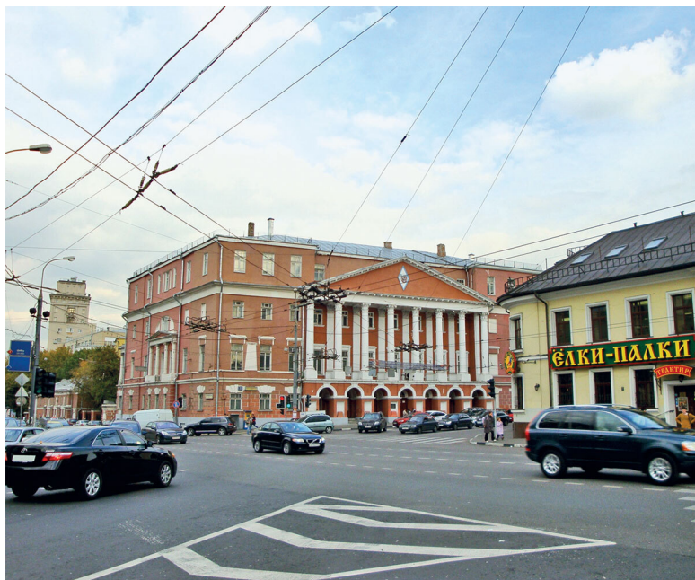
Главная усадьба на Разгуляе

большое массивное здание (№ 20, к. 1) – дом кооператива «Бауманский строитель», начала 1930-х годов. Архитектурный стиль 1930-х ни с чем не перепутаете. И в самом деле, это великолепный образец архитектурного недавнего прошлого Москвы наравне с советским конструктивистским стилем 1920-х, до сих пор почитаемым в среде профессионалов во всем мире.