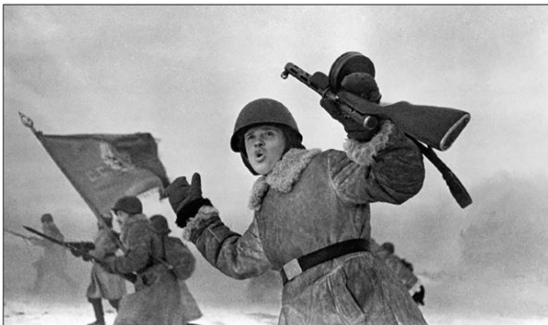
Атакующая советская пехота

Непосредственно под Ленинградом находились силы трех армейских корпусов. Еще три армейских корпуса и III полевой корпус люфтваффе были развернуты вдоль восточного фланга армии.