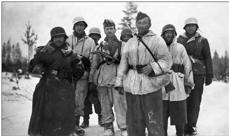
Немецкие солдаты у Рабочего поселка № 6

ка». Городокский узел сопротивления с 8-й ГРЭС представлял собой настоящий Невский «Измаил». Эстакады электростанции, бетонные здания, каменные постройки в самих Рабочих городках гарантировали очень серьезную проблему для наших наступающих войск. Что касается берега Невы севернее, то он был не только хуже прикрыт, но и не имел такой же развитой системы укреплений.