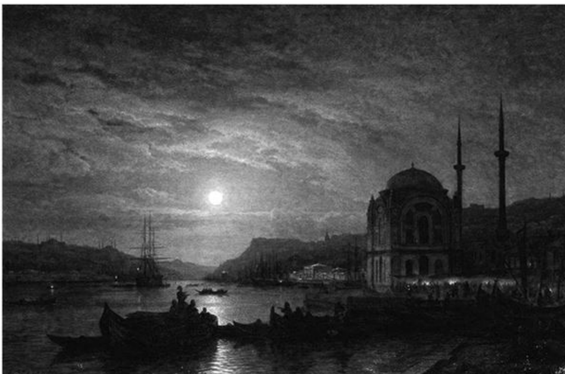
Лунный вечер в Константинополе. С картины Алексея Боголюбова

Впрочем, войны можно было еще избежать – спешно собравшаяся в Вене конференция великих держав в составе представителей Великобритании, Франции, Пруссии и Австрии выработала компромиссную ноту. России предлагалось вывести войска в обмен на признание (пусть и чисто номинальное) права на защиту православных и контроль над святынями в Святой Земле. Николай Первый, со своей стороны, был согласен, но тут против Венской ноты выступил султан – как утверждают, не без усилий британского посла. Как результат, дипломатический документ подвергся серьезному редактированию, и это была уже новая нота, на которую щепетильный в таких вопросах российский император уже не согласился.