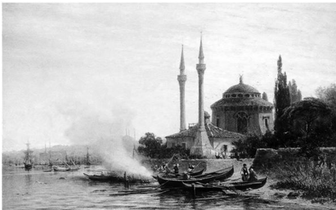
Залив Золотой Рог в Константинополе. С картины Алексея Боголюбова

Восьмого февраля 1833 года на берегах Босфора появилась русская эскадра в составе четырех линейных кораблей и пяти фрегатов под флагом начальника штаба Черноморского флота контр-адмирала Михаила Лазарева, героя Наваринского морского сражения и кругосветного мореплавателя. Силы эскадры подкреплялись 30-тысячным десантом. Этот поход позже получил название Босфорской экспедиции .