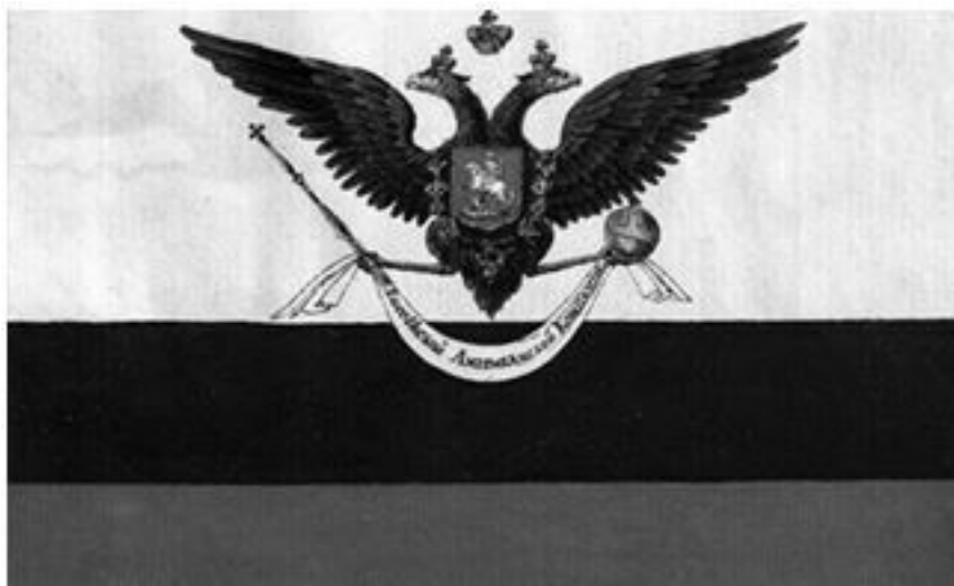
Флаг Российско-Американской компании

Главной задачей компании была монопольная эксплуатация природных богатств Аляски 10 , для чего строились фактории, основывались населенные пункты, число которых к началу 1820-х годов выросло до пятнадцати. Столицей Русской Америки был город Новоархангельск (на языке местных жителей – Ситха, современная Ситка), где имелись театр, библиотека и астрономическая обсерватория.