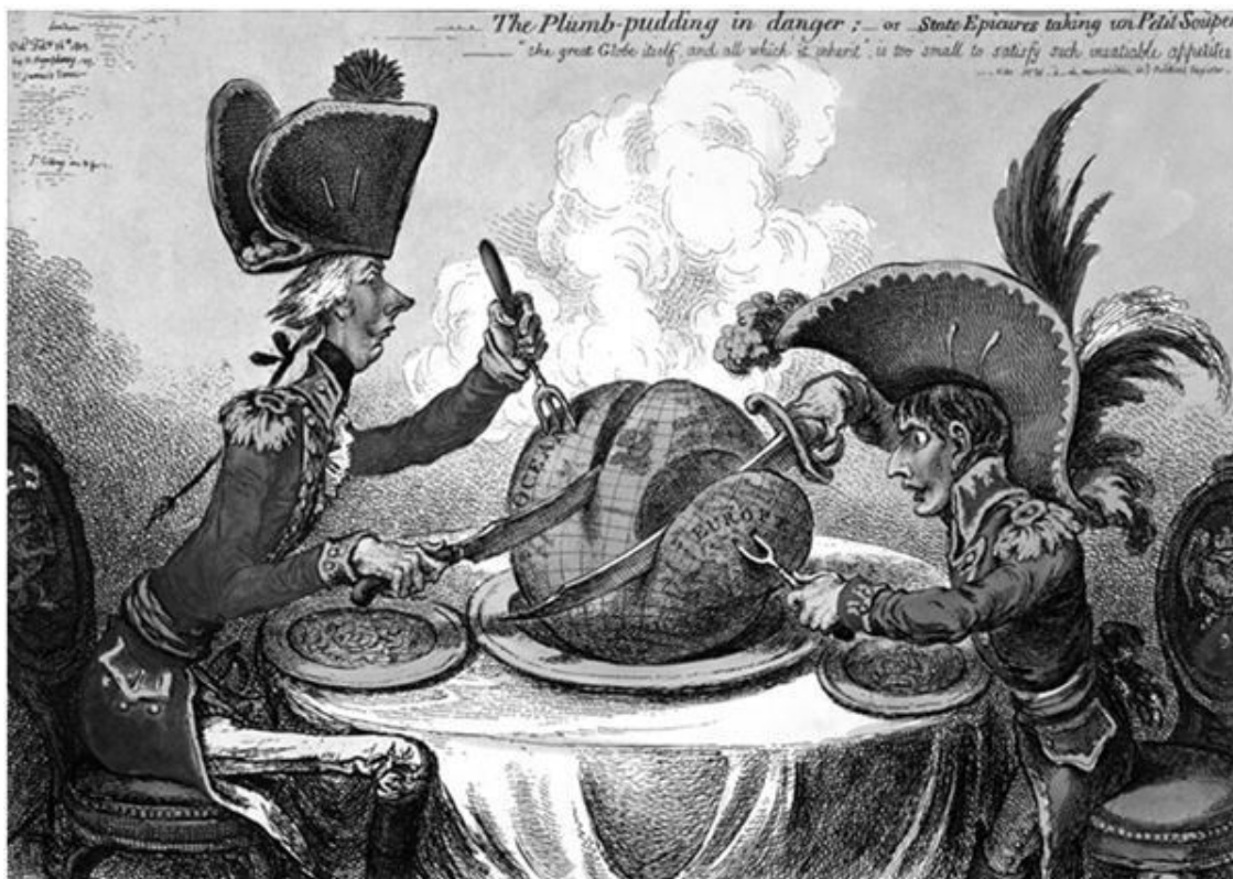
Сливовый пудинг в опасности. С карикатуры Гилроя

Надо сказать, что с начала XIX века Великобритания, казалось, думала только о том, как бы прирастить свою территорию и сферу влияния – если не официально, то экономически. В 1805 году британский карикатурист Гилрой опубликует свою знаменитую карикатуру – «Сливовый пудинг в опасности». На картинке английский король Георг Третий и французский император Наполеон Первый делят земной шар. Французу достается Европа, а англичанину – океан.