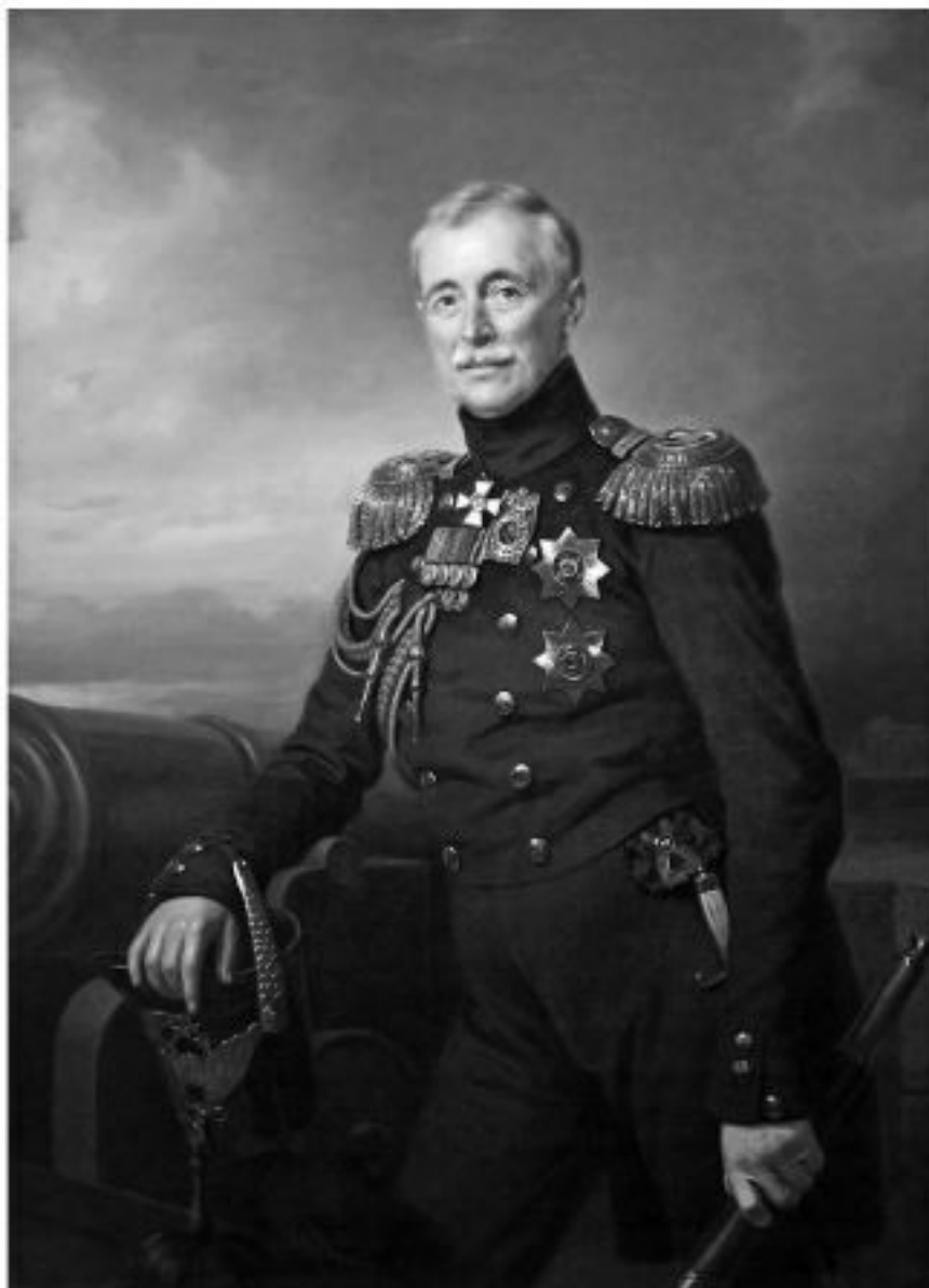
Князь Александр Меншиков. С картины Франца Крюгера

В феврале 1853 года в Стамбул (в России его называли исключительно по-старому – Константинополем ) направляется дипломатическая миссия светлейшего князя адмирала Александра Меншикова, начальника Главного Морского штаба и прямого потомка «полудержавного властелина». В ответ Франция усиливает эскадру в Средиземном море, а британский посол делает все, чтобы убедить султана Абдул-Меджида Первого в необходимости удовлетворения русских требований. «Удовлетворение», правда, было весьма своеобразным – очередной фирман владыки правоверных декларировал нерушимость прав «греческой церкви» на Святые места. Но – без каких-либо преференций для Российской империи.