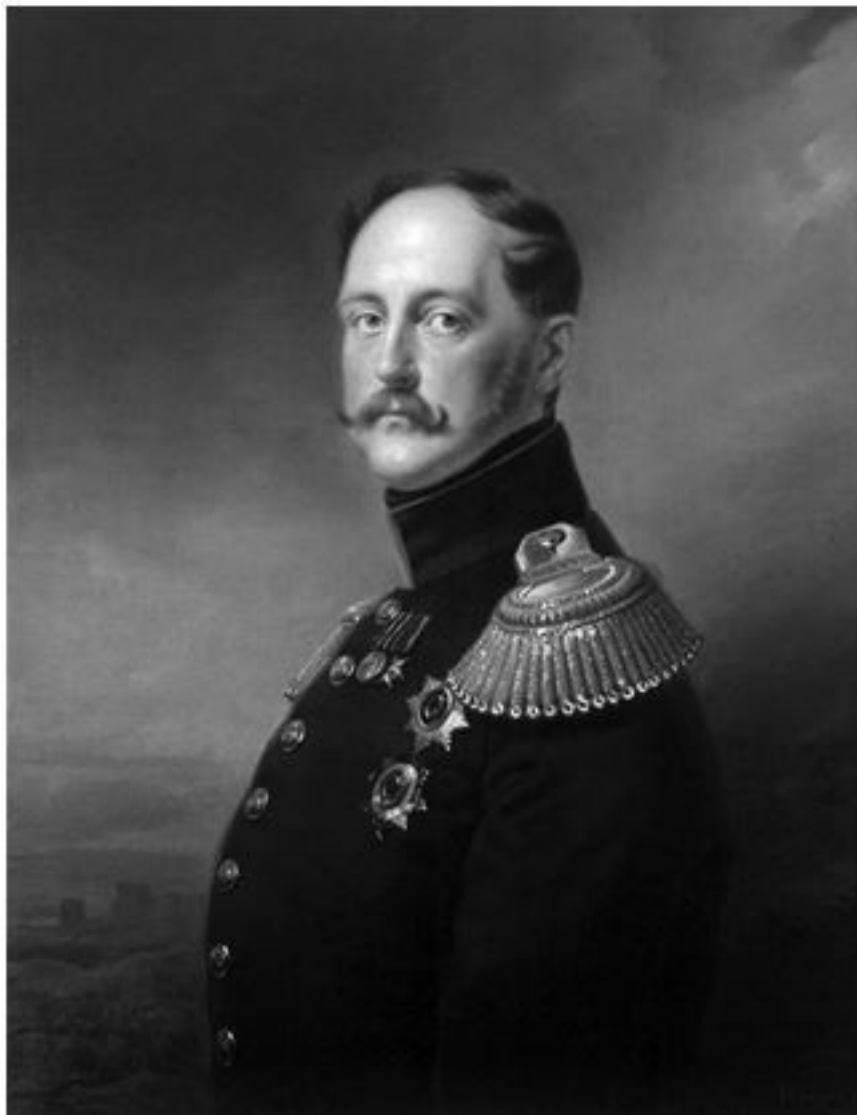
Император Николай Первый. С картины Франца Крюгера

в 1852 году писателем Виктором Гюго «Наполеоном Малым» 30 ) были, мягко говоря, довольно сомнительны.