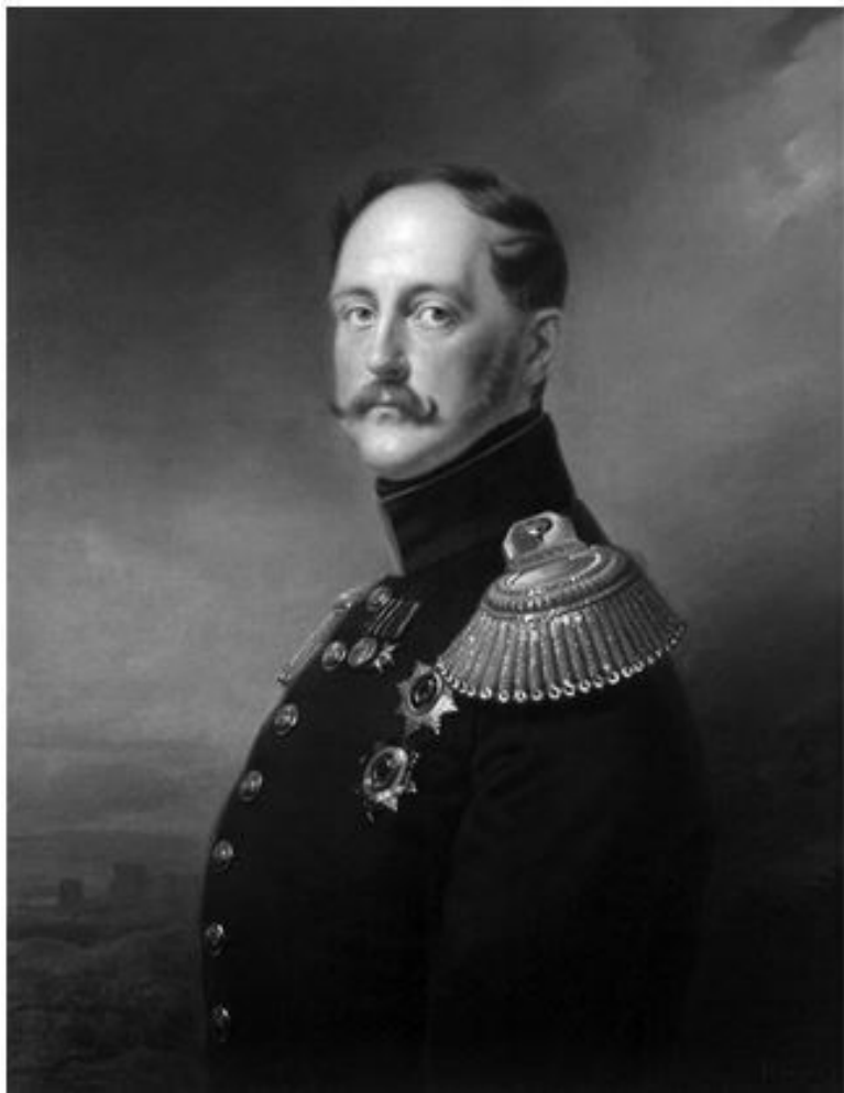
Император Николай Первый. С картины Франца