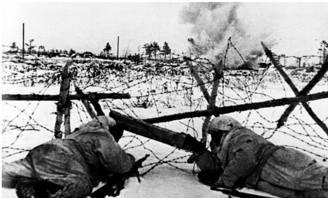
Саперы проделывают проходы в проволочном заграждении

Для обеспечения маневра и развертывания войск за два дня до наступления были сплошь разминированы советские минные поля на фронте 2-й Ударной армии протяженностью 15 км. В ночь перед атакой 9 саперных рот перед фронтом трех стрелковых дивизий первого эшелона 2-й Ударной армии проделали 109 проходов в минных полях противника и заложили удлиненные заряды в проволочные заграждения. В ходе артподготовки заряды были подорваны, образовав 109 проходов в местах, соответствующих проходам в минных полях.