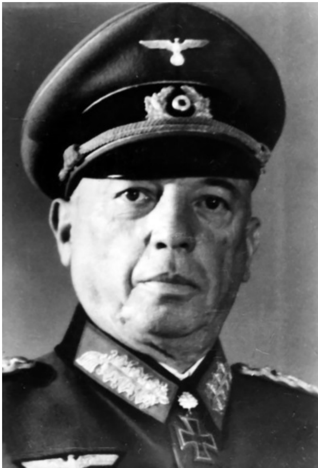
Фельдмаршал Кюхлер, командующий ГА «Север»

Немецкое командование, стремясь сохранить блокаду, на все изменения в ходе советских действий реагировало с исключительной оперативностью. Наступления Ленинградского фронта немедленно вызвали перегруппировку войск из других направлений. Так, в период активных действий 67-й армии на Невском направлении с Волховского фронта сюда были передислоцированы 28-я, 21-я, 96-я пехотные дивизии, 5-я горнопехотная дивизия, а также несколько полков. И это в то время, когда Волховский фронт сам вел наступление. Также в