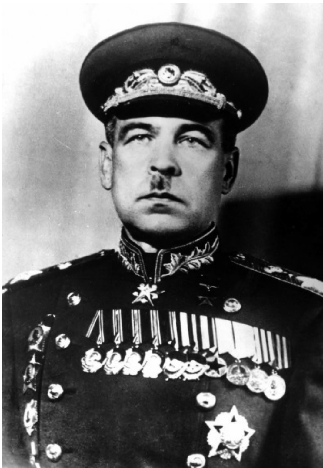
Командующий Ленинградским фронтом маршал Советского Союза Говоров Л. А.

Командующий фронтом генерал Говоров пришел к выводу, что прорыв обороны противника со стороны Ленинграда должен был быть осуществлен на сильно укрепленном Пулковско-Красносельском участке. Овладев Красным Селом, войска кратчайшим путем выходили к Гатчине, нанося удар в тыл немецкой группировке. Для дезориентации противника Говоров считал нужным нанести удар с Ораниенбаумского плацдарма раньше. По его словам, «выбор формы прорыва в виде двух concentрических ударов, наносившихся на относительно