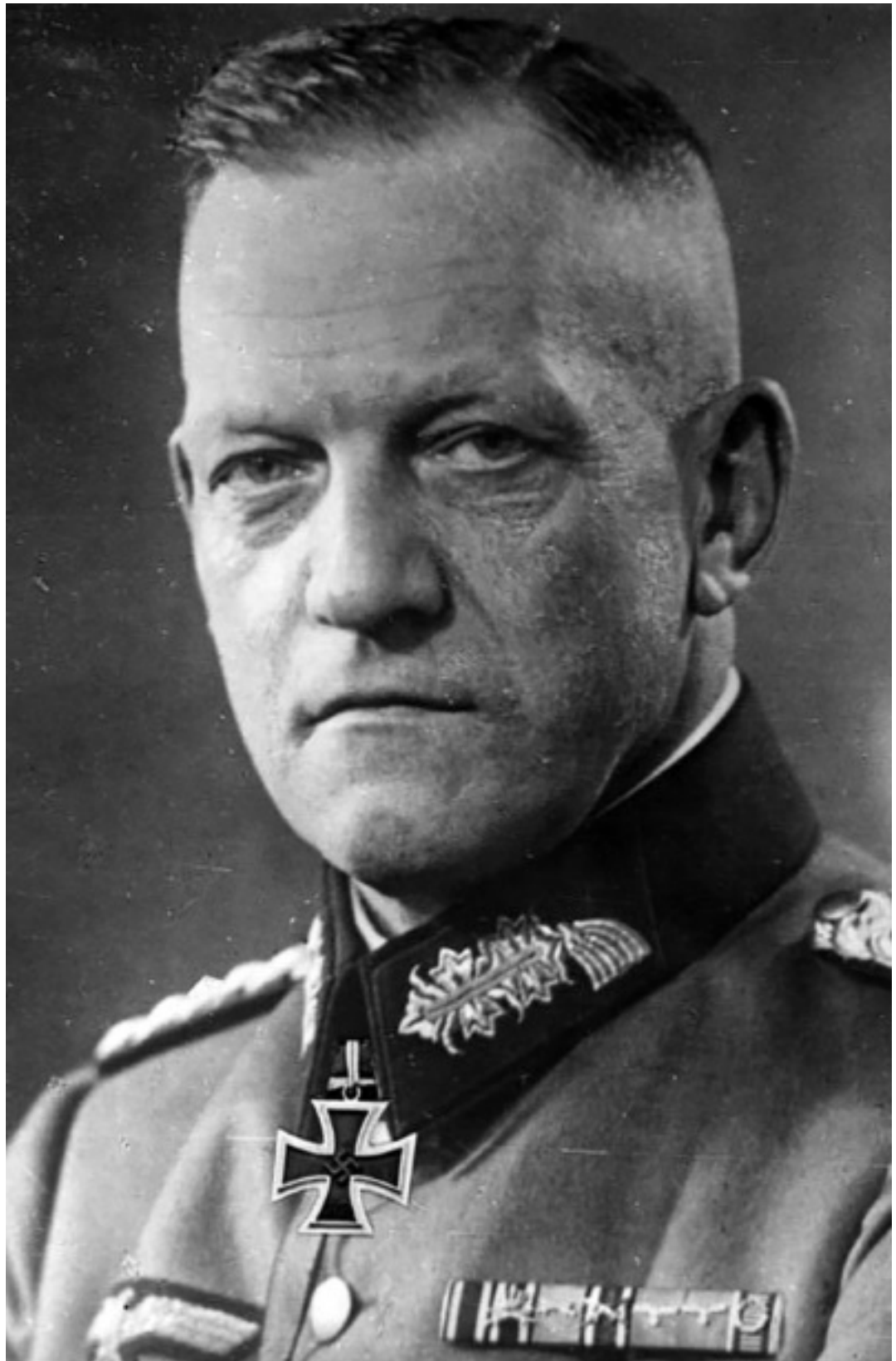
Генерал Линдеман, командующий 18-й армии

31 декабря Цейтлер сообщил Кинцелю (начштаба ГА «Север»), что Гитлер начал колебаться, после того как Кюхлер сам рассказал о мнении командующего 18-й армией Линдемана. Цейтлер пообещал вернуться к обсуждению вопроса о проведении операции «Блау» через неделю, а также просил ГА «Север» ответственно сообщить: а) способна ли 18-я армия на теку-