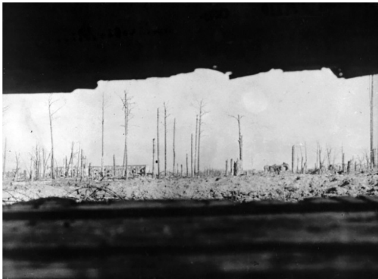
Вид из амбразуры немецкого ДЗОТ.

Первая оборонительная полоса противника перед фронтом 42-й армии была построена по принципу ротных и батальонных ОП и к концу 1943 г. представляла собой сплошную оборону глубиной 4–6 км. Передний край проходил от Финского залива через Урицк, Ст. Паново, Кискино, Венереязи, Нов. Сузи, Александровское до Пушкина.