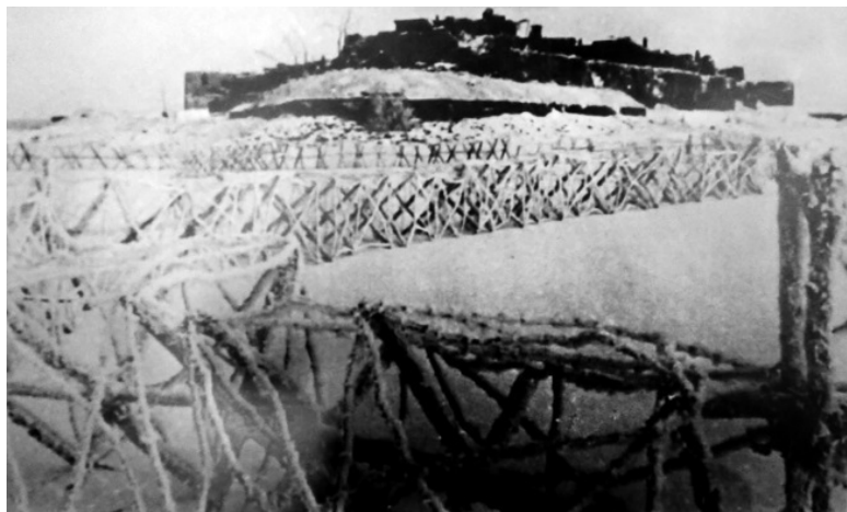
Немецкий ДОТ у Колтино

ше). Они располагались в глубине за обратными скатами и не ближе 1,5–2 км от переднего края (4, с. 86–87).