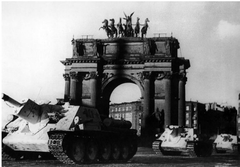
СУ-122 мимо Нарвских ворот выдвигаются к фронту

110-й ск, развернутый на левом фланге одной стрелковой дивизией, должен был прорвать оборону противника на фронте Редкое Кузьмино – Бол. Кузьмино. Ближайшая задача – уничтожить врага в районе Александровки и овладеть рубежом Куйтелево – Боболово – сев. часть Александровки – Бол. Кузьмино. В последующем, закрепив указанный рубеж, правым флангом развивать наступление вдоль Варшавской ж/д и, обеспечивая слева удар армии на Красное Село, овладеть рубежом (иск) Коврово – Кондакопшино – Капино. Затем, организовав разведку на Нов. Гонтолово, Бол. Катли-