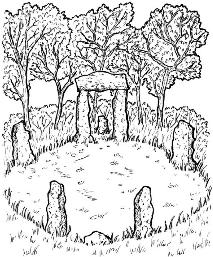
Роща и круг

Описать священные места и практики можно самыми раз-