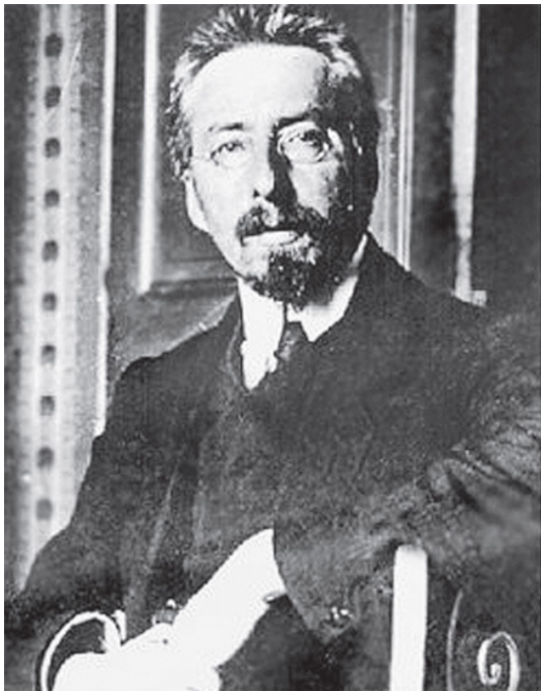
Портрет В. Д. Бурцева