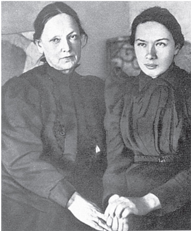
Е. В. и Н. К. Крупские

В 1897–1900 годах в доме жил учившийся во втором