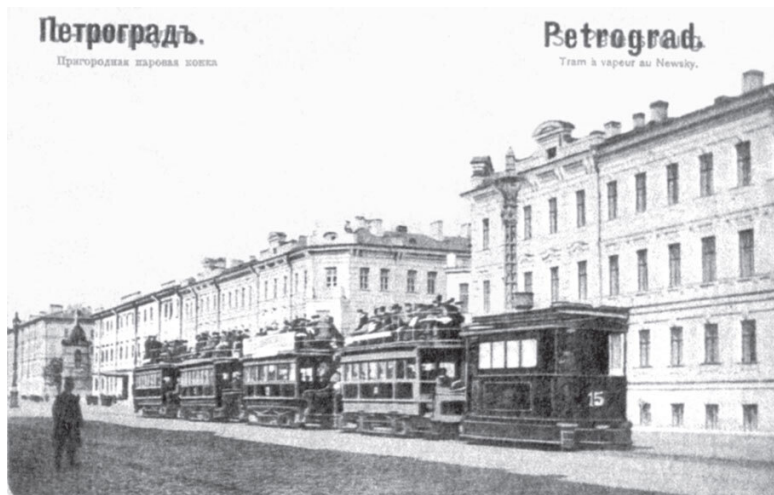
«Пароконка» у домов 174 и 176. Открытка 1914 г.

Гольдгор, дом 184, архитектор А. В. Васильев, 1955). Время конца XX – начала XXI веков ознаменовалось перестройкой зданий, возведенных в середине XIX века, сначала скромно стилизуемых под архитектуру ушедшего времени (дома 99–101), а затем в откровенно современной манере (дома 133–137, архитекторы Е. Л. Герасимов, С. Д. Меркушева, К. В. Смирнов; дом 152).