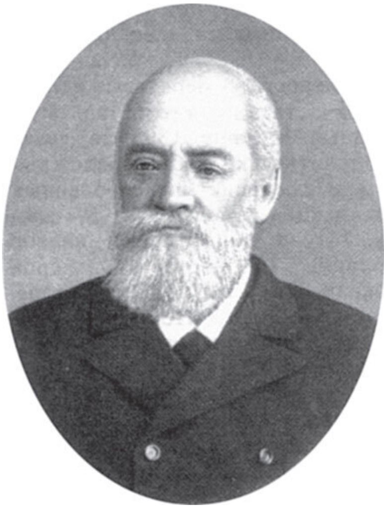
Портрет Н. Д. Ахшарумова