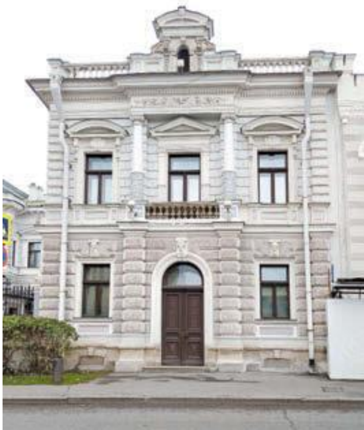
Флигель. Софийская наб., 14, стр. 3.

Только два здания среди запустения радовали прохожих – усадьба Харитоненко и Дом бесплатных квартир Бахру-