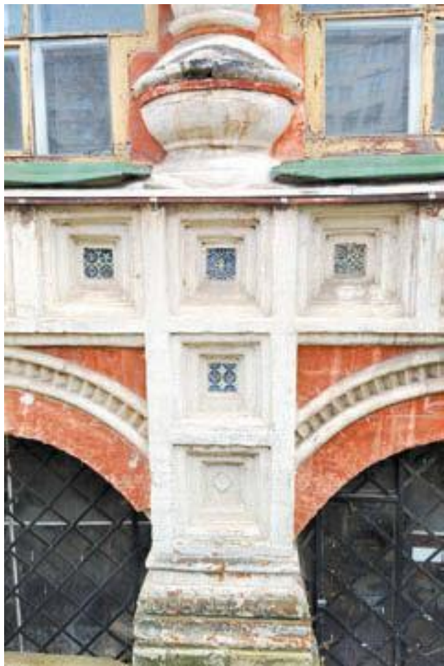
Палаты Аверкия Кириллова, Берсенеvская наб., 20.