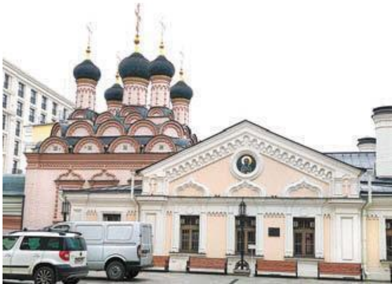
Храм Софии Премудрости Божией в Средних Садовниках.

Государев сад сгорел в 1701 году, и его решили не возрождать. На его месте образовалась большая торговая Болотная площадь с деревянными лабазами и большим каменным Гостиным Двором. У каждого московского рынка существовала специализация. По воспоминаниям писателя Ивана Шмелева, на Болоте торговали ягодами и фруктами. В 1930-е годы Гостиный Двор разобрали и торговую площадь превратили в сквер. В 1948 году соорудили фонтан, причем, по легенде, чаша фонтана отлита из металла разбитых немецких