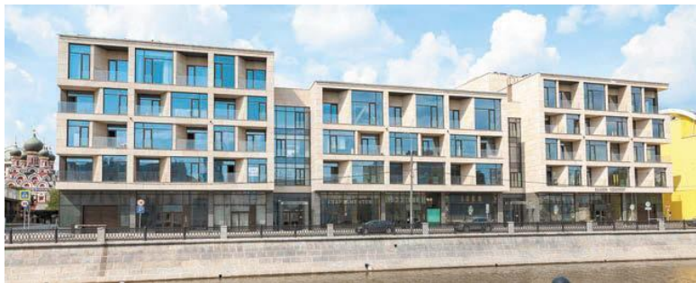
Садовническая наб., 7.

ные скромные, но четко очерченные кубики любят возводить в европейских городах. В 2018 году комплекс апартаментов здесь поставил немецкий архитектор, автор жилых домов в Сколково Хади Тегерани (Садовническая наб., 7). В похожем стиле, но гораздо помпезнее и намного медленнее большая группа отечественных архитекторов уже который год возводит громадный гостиничный комплекс «Царев сад» (Софийская наб., 34).