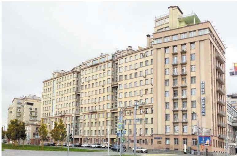
Дом на набережной, Серафимовича ул., 2.

Это первое крупное сооружение советской власти во многом показательная стройка. Когда правительство во главе с Лениным в 1918 году переехало в Москву, ответственных работников расселили в Кремле, центральных гостиницах «Националь», «Метрополь», «Петергоф» и нескольких больших доходных домах. Но квартир для чиновников все равно не хватало, и приняли решение построить жилой комплекс для руководящих работников – сотрудников ЦИК и СНК, высших органов власти Советского Союза. Официальное название постройки – Первый Дом Советов. Но после выхода в 1970-е годы романа «Дом на набережной» писателя Юрия