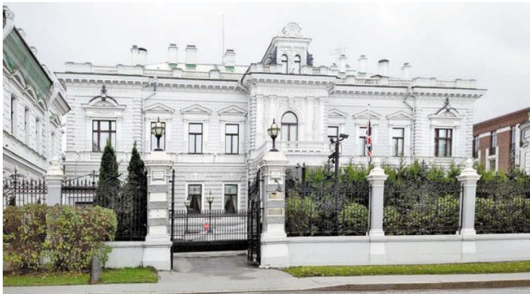
Софийская наб., 14.