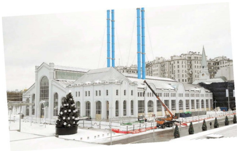
Реконструкция – ГЭС–2, Болотная наб., 15, корп. 1.

Вдоль основного русла Москвы-реки за кондитерской фабрикой стоят палаты боярина Кириллова (Берсенеvская наб., 20). «Берсень» по-старинному – «крыжовник», отсюда и название – Берсенеvская набережная. С XII века на этом месте разводили сады с кустами крыжовника, малины, яблонами. Думный дьяк Аверкий Кириллов как раз и заведовал царскими садами. Палаты – редкий в Москве образец здания в стиле барокко. Так начали строить при Петре Первом. Для этого времени характерен ступенчатый голландский силуэт дома, с завитками-волютами и круглым окном.