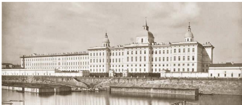
Воспитательный дом, фото 1883 года.

ли Бахрушины приобрели участок на Софийской набережной и построили на нем в 1903 году по проекту архитектора Карла Гиппиуса дом бесплатных квартир для нуждающихся вдов с детьми и учащихся девушек (Софийская наб., 26). Всего в здании было 456 небольших, в одну комнату, квартир площадью от 13,2 до 30,4 метра. Кухни не предполагалось, ведь при доме была столовая, а также начальное училище, два детских сада, аптека, амбулатории и ремесленные мастерские, где бесплатно обучали девушек. Купол на здании показывает, что при доме была церковь Николая Чудотворца.