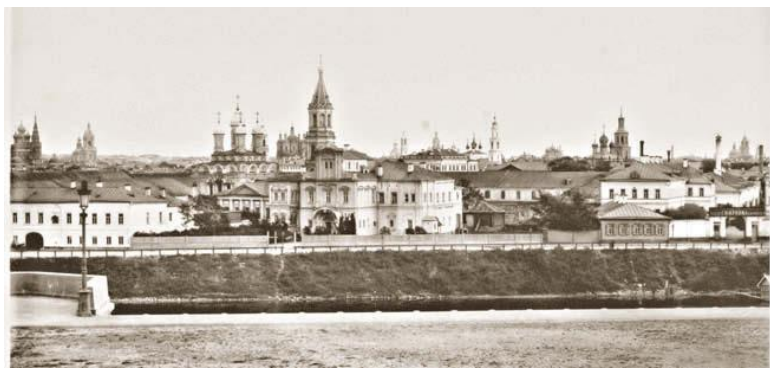
Вид Берсеневской набережной от храма Христа Спасителя, 1884 год.

Со стороны канала к корпусам кондитерской фабрики «Эйнем» примыкала Вторая городская электростанция – ГЭС-2 (Болотная наб., 15, корп. 1). Ее построили в 1907 году для обеспечения электричеством городского транспорта и одно время называли Трамвайной. На строительство и оборудование Трамвайной станции городская казна потратила 2,1 миллиона рублей. Архитектор Василий Башкиров украсил длинный корпус машинного зала высокой башней с часами, и электростанция стала похожа на костел. После строительства рядом в 1931 году Дома правительства его отапливали теплом станции, а один из котлов ГЭС-2 перепрофилировали для обеспечения паром прачечной Дома правительства. В момент написания этой книги здание электростанции перестраивают для создания арт-пространства.