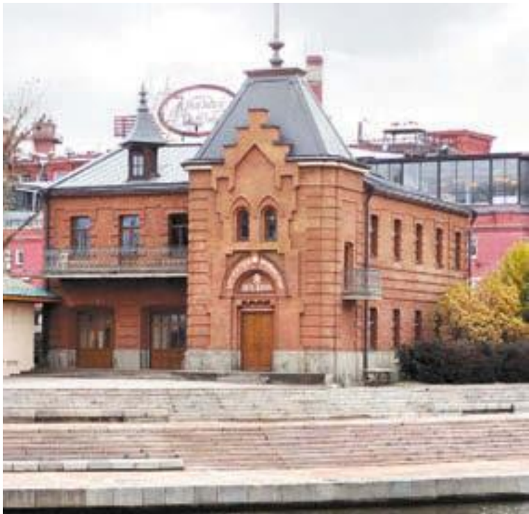
Здание Московского императорского яхт-клуба, Болотная наб., 1, стр. 1.

Наш маршрут проходит от западной оконечности острова до восточной. Но не обязательно подходить к Петру вплотную. Он огромный, и осматривать статую можно с Крымской набережной, с территории парка искусств «Музеон». Кстати,