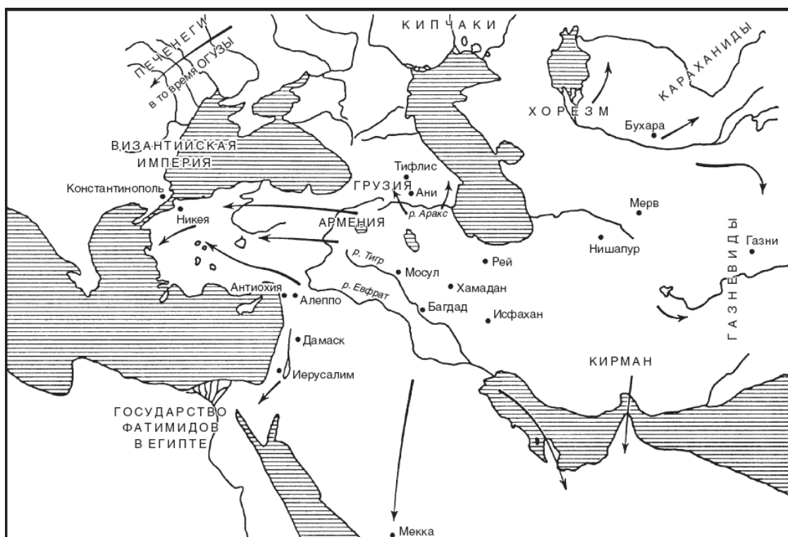
Империя Сельджуков в конце XII века

В последние годы жизни хорасанская ветвь рода Сельджука доставляла Махмуду больше проблем, чем пользы. Напрасно он держал в заложниках Израила, который, судя по всему, умер в крепости на границе с Индией. Скотоводы-огузы были не в состоянии уважать запрет на доступ в развитые, хорошо управляемые провинции. В 1029 году ему пришлось отправить их назад. Ускользнув от него, они сбежали через Иран в Азербайджан, где местные правители, чтобы избежать разорительных набегов, с радостью наняли их для использования против своих соперников и даже для набегов на армяно-византийские границы. Так в этих местах впервые появились воины, которым позже было суждено сыграть там такую важную роль. В какое-то