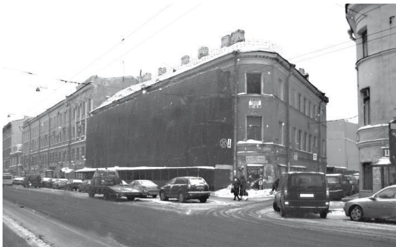
Загородный проспект, д. 3