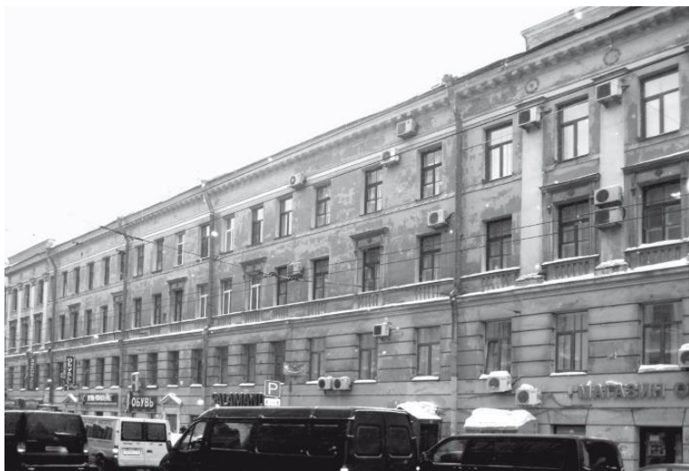
Загородный проспект, д. 5