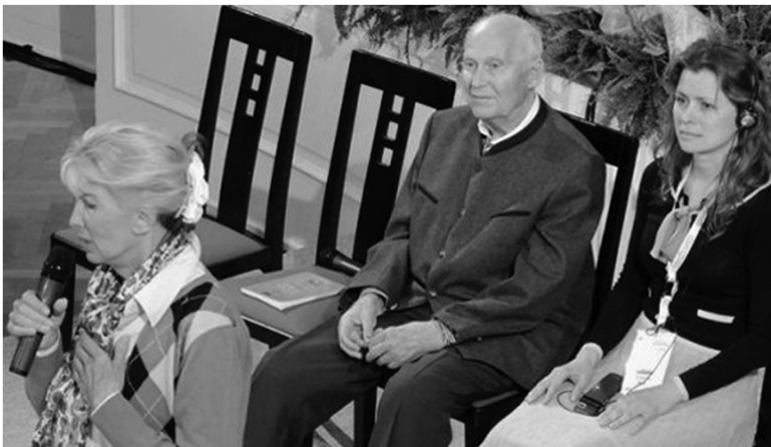
Фото расстановки в школе Берта Хеллингера моего вопроса о трудности в зачатии. 2012 г.

То, что показала расстановка, провозглашало одну простую истину: «Путь к здоровым детям лежит через признание себя матерью предыдущего ребенка» . Я завершила путь и ритуалы траура по нерожденной дочери, которые заключались в том, чтобы дать ей имя – Кристина, поставить свечку за ее упокой в церкви и у себя дома в течение 9 дней, написать ей письмо со своими мыслями и чувствами, затем сжечь это письмо, отпуская душу нерожденного ребенка. Поговорить о нем со своими близкими, рассказать своим детям, что он был у вас, отмечать какой-то из дней в году как день его памяти. Также важно пройти очищение на энергетическом уровне своего эфирного тела, так как следы переживаний аборта остаются и там.