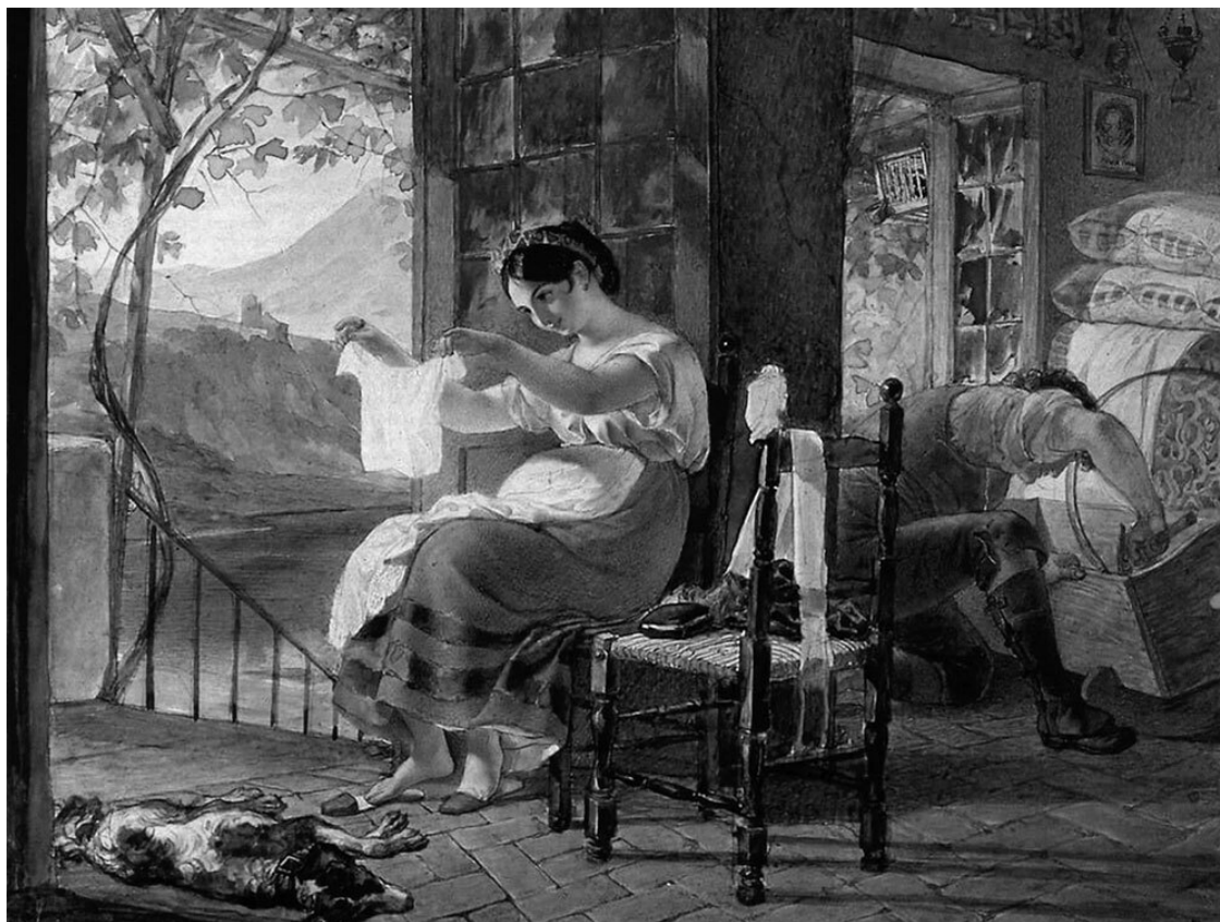
Рис. 2. Карл Брюллов. Итальянка ожидающая ребенка

Чтобы понимать, как внутриутробно развивается ребенок, привожу краткую периодизацию: мозг начинает развиваться уже на третьей неделе с момента зачатия. Сначала это нервная трубка, на которой на 25-й день появляются три мозговых пузыря. Первыми развиваются сенсорные зоны, необходимые для наших органов чувств, например зрения или слуха. Затем приходит время развития зон языковых навыков и познавательных функций.