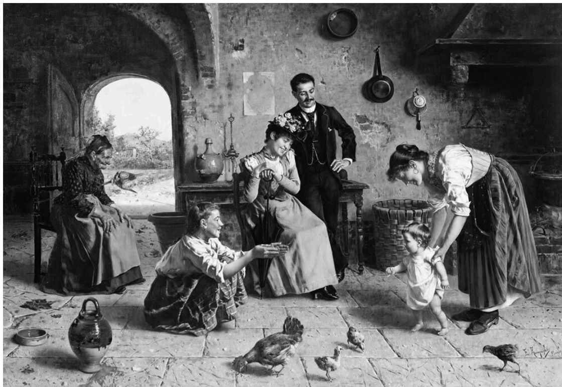
Рис. 4. Эудженио Дзампиги. Первые шаги

После 1 года ребенок научается делать первые шажочки. Это первая физическая автономия и свобода, когда он выбирает первое собственное направление в движении, уже очень хорошо ползает, а теперь становится на ножки, чтобы ходить. В этом возрасте происходит резкий переход: когда ребенок только-только слабо держался на ножках, а в 13 месяцев уже уверенно делает первые шаги. Он это чувствует и безмерно радуется. А в 1,5 года он уже уверен, что умеет ходить!