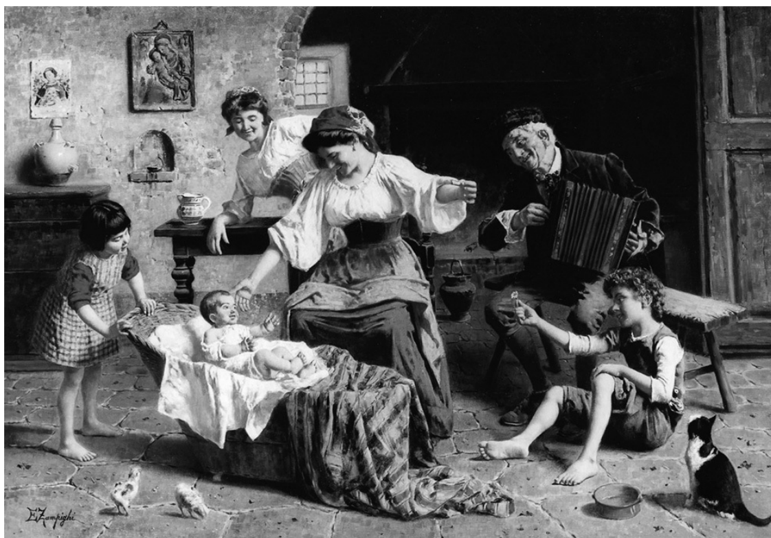
Рис. 1. Эудженио Дзампиги. В центре внимания