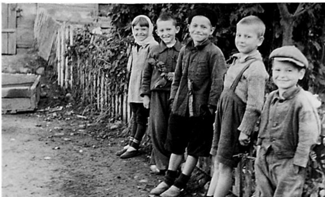
Дети осажденной Москвы. 1941

Жмурик вошёл прямо, недвижно держа седую голову. Разжал губы в сухой усмешке. Мы стояли «смирно»: кто в кальсонах, кто в брюках, а кто и просто в одной нательной рубашке – целая ватага юных голых парней и мужчин, ибо некоторые уже пользовались благосклонностью юных, а то и зрелых дам. Ребята все, как на подбор. От белизны и чистоты тел аж воздух светится... Жмурик не стал отчитывать за нарушение формы одежды. Не меняя выражения лица, сказал чеканно: