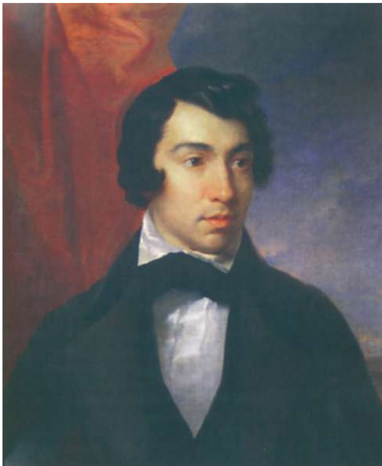
На фронтисписе автопортрет А. С. Хомякова (2-я пол. 1830-х гг.).