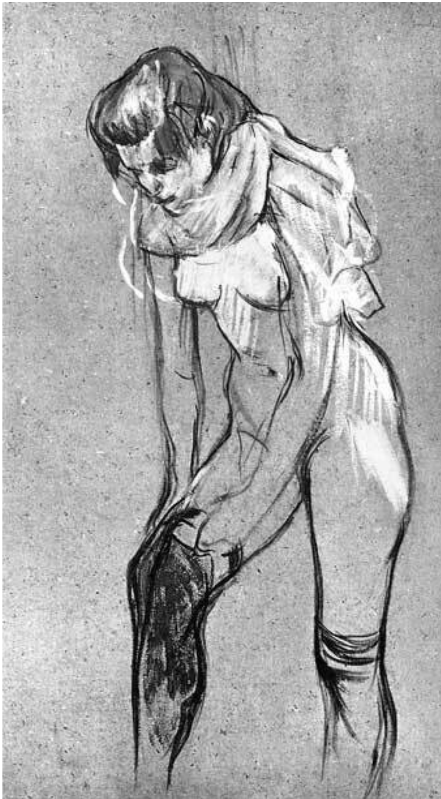
Женщина, подтягивающая чулок. Художник Анри Тулуз-Лотрек

Тем не менее в процессе формирования нашей личной жизни мы смогли занять позицию, которую можно назвать сексуально-экономической. Следует показать на немногих примерах, чем уже сегодня является «сексуально-экономическая мораль» и в какой мере она предвосхищает «мораль будущего».