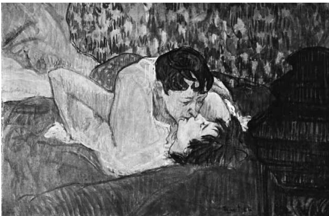
Поцелуй. Художник Анри Тулуз-Лотрек

Половой акт как таковой не является ни нравственным, ни безнравственным. Порожденный сильным природным влечением, он становится таким или другим только под действием мышления и сопутствующих развитию человека обстоятельств. Значение сексуальности не исчерпывается, конечно же, ее важнейшей ролью – продолжением рода.