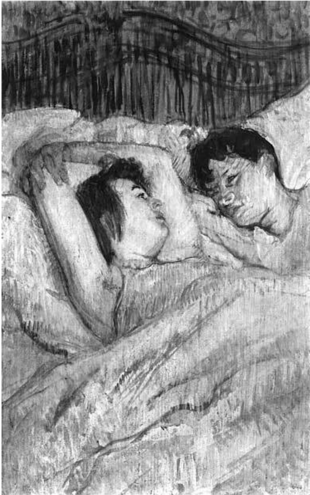
В кровати. Художник Анри Тулуз-Лотрек

Нынешние государственные мужи – это друзья, родные, двоюродные братья и другие родственники крупных капиталистов или диктаторов. Проблема заключается в том, что масса мыслящих, отчасти культурных и образованных людей не видит этого и не реагирует соот-