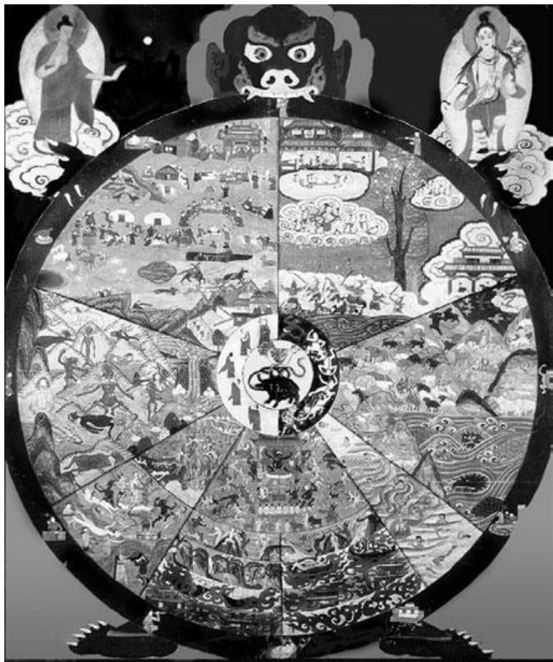
Бхаваачakra. "Колесо существования" XIX в. Грунтованное полотно, минеральные краски. 204×165