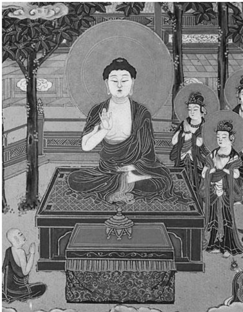
«Проповедь Шакьямуни. Шакьямуни и Шарипутра»