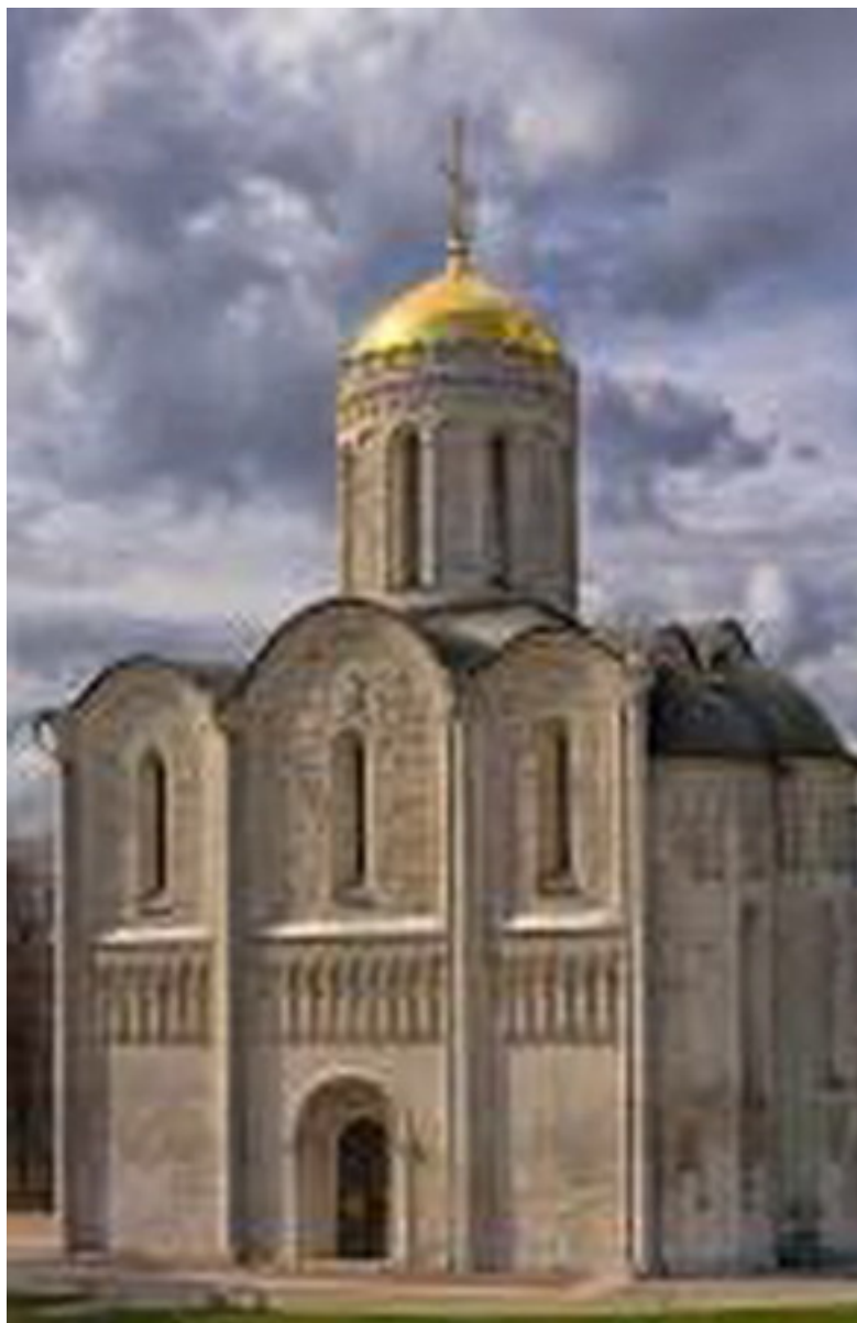
Дмитриевский собор во Владимире

Дмитриевский собор. Дмитриевский собор был построен князем Всеволодом (Дмитрием) Юрьевичем в 1192–1194 гг. при своем великокняжеском дворце, в честь его небесного покровителя св. мч. Димитрия Солунского. Некоторые исследователи полагают, что за образец был взят храм Покрова на Нерли при дворце великого князя Андрея Боголюбского.