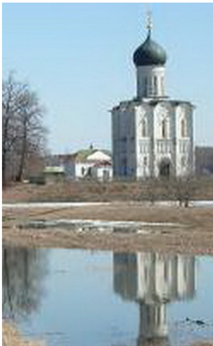
Храм Покрова на Нерли