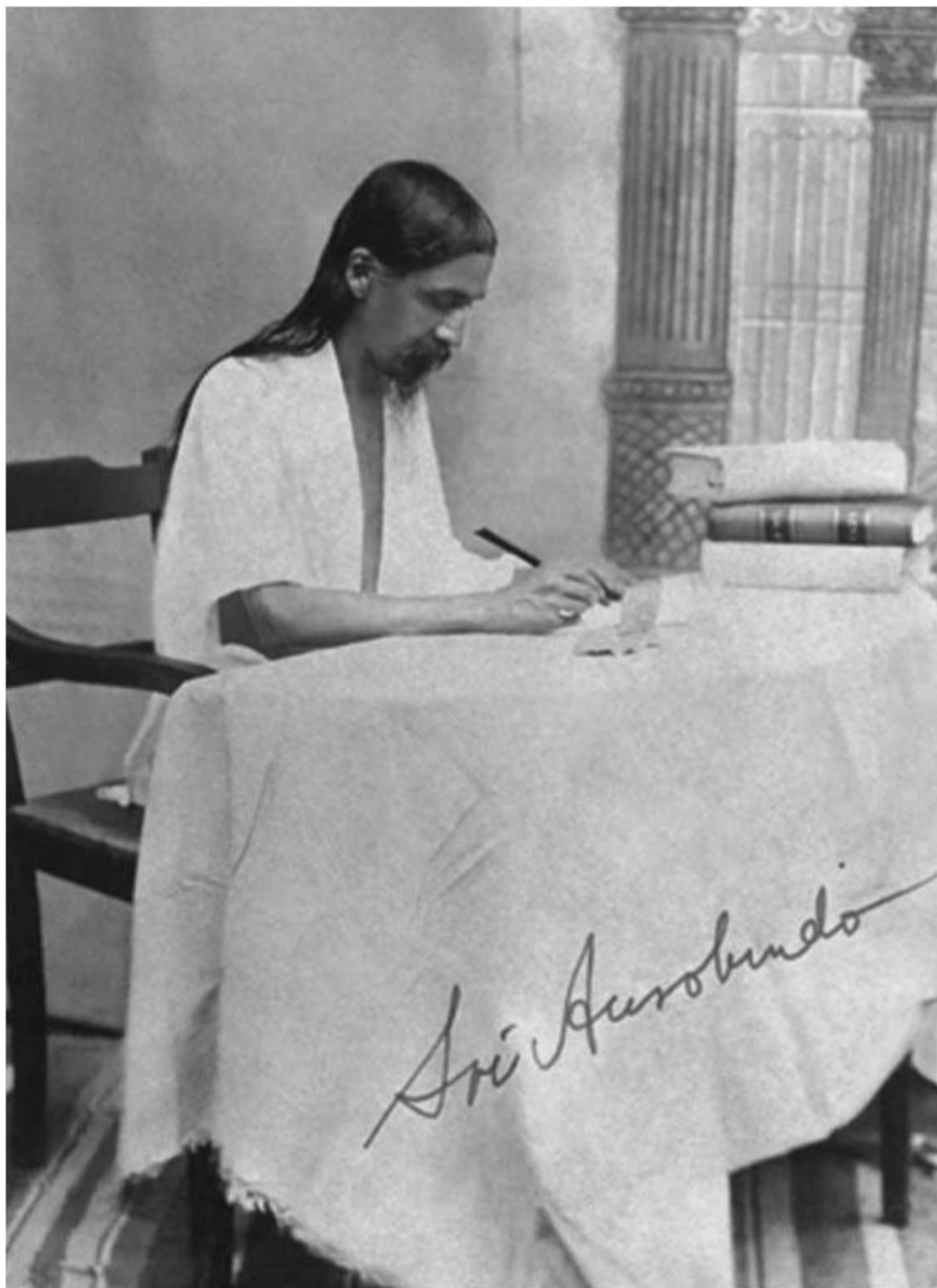
Шри Ауробиндо. Пондичери, 1915–1918 г.