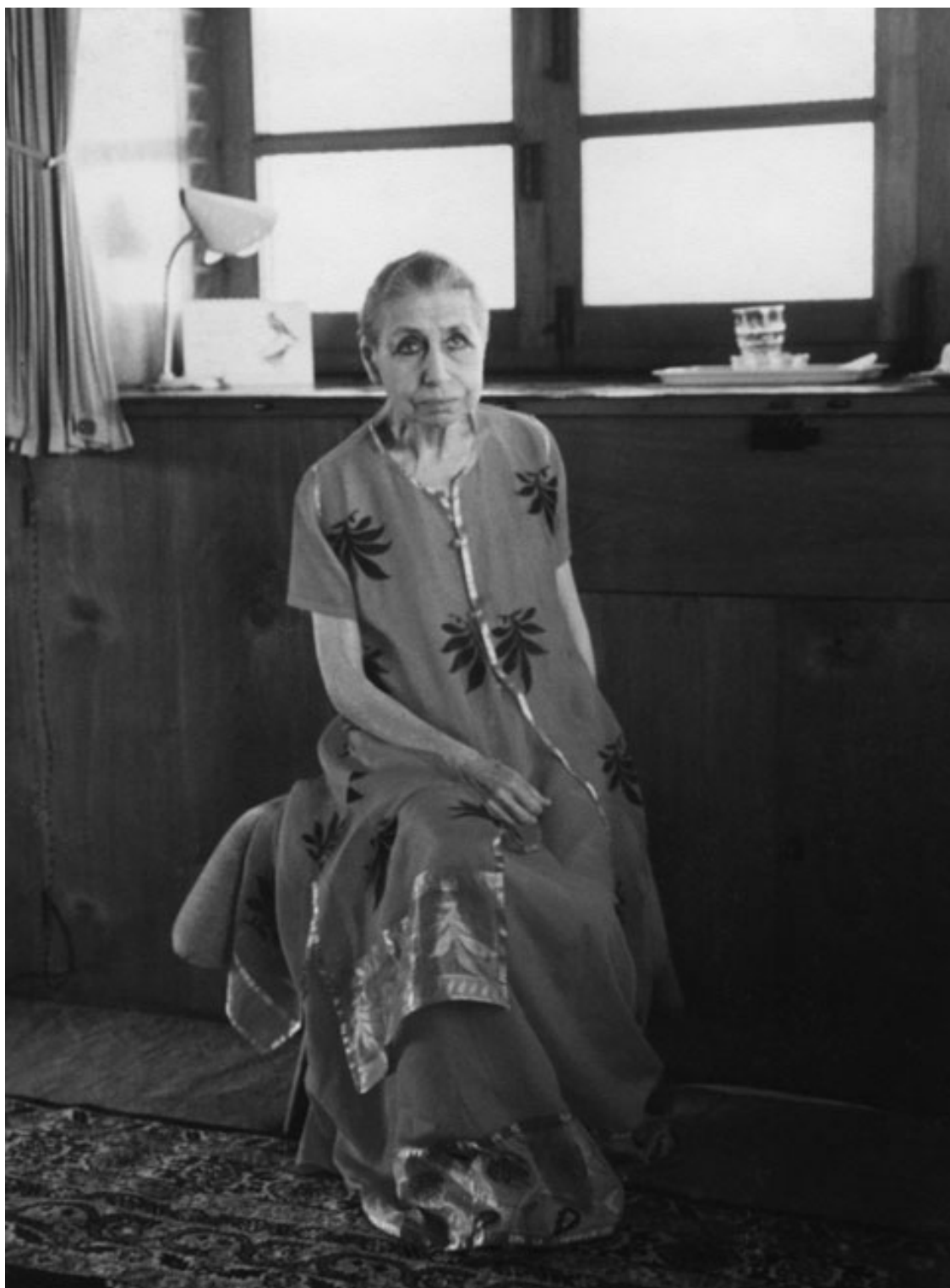
Мать – апрель 1950 г.