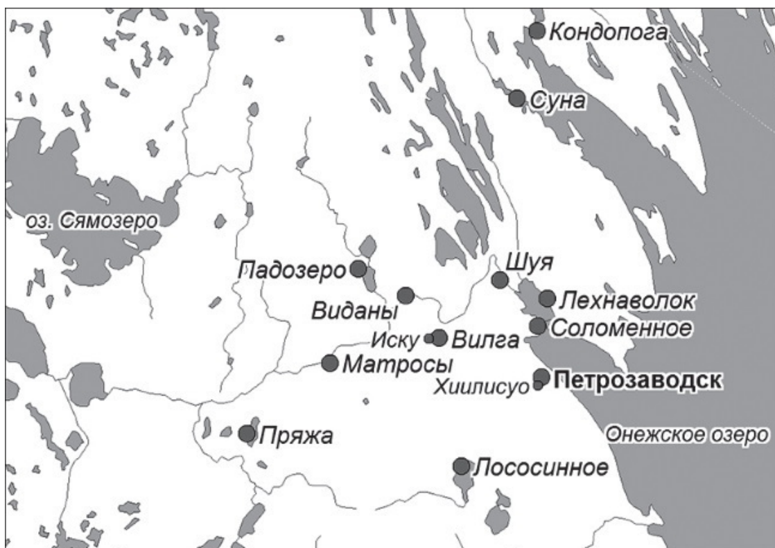
Поселения со значительным количеством североамериканских иммигрантов в Карелии 1930-х гг.

Финская иммиграция из Северной Америки шла практически исключительно в Карелию и лишь в единичных случаях – в другие регионы СССР. Именно Карелия была тем социалистическим Эльдорадо, ради которого тысячи американских и канадских финнов оставили свой привычный образ жизни, дома, друзей, клубы и работу. Имея протяженную (800 км) границу с Финляндией, Карелия в течение многих веков была местом трансграничных контактов и международных конфликтов, сначала в контексте шведско-новгородской борьбы, а затем московско- и русско-шведских войн за контроль над восточной частью Балтийского моря, пока, наконец, по Фридрихсгамскому мирному договору 1809 г., закончившему последнюю русско-шведскую войну 1808–1809 гг., Российская империя не получила Финляндию под свой контроль. Вскоре вопрос о Карелии стал важной частью российско-финляндского диалога и противостояния, сначала в культурно-просветительской и религиозной, а затем, после обретения Финляндией независимости, и в политической, дипломатической и военной сферах.