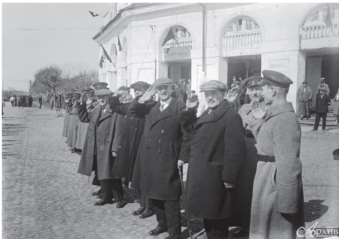
Красные финны, руководившие Советской Карелией в 1920–1935 гг.:

Революция 1917 г. и последовавшая гражданская война в России привели к распаду Российской империи, в том числе к провозглашению независимости Финляндией. В 1918–1922 гг. финские добровольцы предприняли несколько попыток присоединить ряд российских территорий, населенных карелами, военным путем, в то время как официальный Хельсинки пытался добиться того же самого с помощью дипломатии 60 . Одним из аргументов присоединения к Финляндии «соплеменных» территорий было отсутствие у восточных карелов автономии и права на самоопределение. Это стало одной из причин, по которым в 1920 г. советское правительство объявило о создании карельской автономной республики 61 . Первоначально она называлась Карельская Трудовая Коммуна, а с 1923 г. – Автономная Карельская Советская Социалистическая Республика 62 . К началу 1922 г., когда финляндские дипломаты вынесли вопрос о международном статусе Советской Карелии на рассмотрение Лиги Наций, аргументируя это стремлением карельского населения к самоопределению, у советского правительства был весомый контраргумент: автономия в составе РСФСР уже являлась выбранной самими карелами формой национального самоопределения 63 .