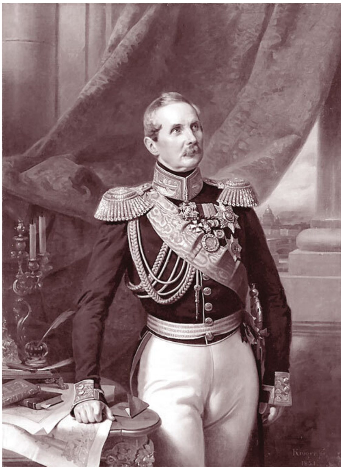
Граф Петр Андреевич Клейнмихель С картины Ф. Крюгера. Государственный Эрмитаж

Клейнмихель принадлежит к числу лиц наиболее замечательных в царствование Императоров Александра I и Николая I, {а потому нет сомнения, что описание его действий с начала его службы до назначения главноуправляющим путями сообщения найдет место в воспоминаниях этого времени, составленных очевидцами, которые и подробнее, и правильнее опишут их. Для пояснения же его положения в описываемое мною время} я ограничусь изложением только некоторых сведений об его прошедшей жизни.