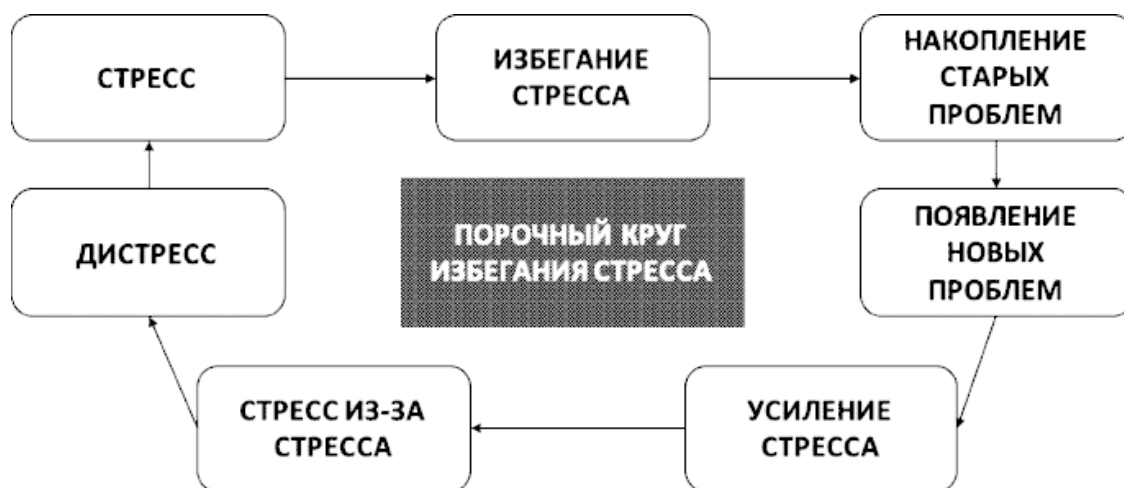
Рис. 3. Порочный круг избегания стресса

По причине накопления старых и образования новых проблем вы испытываете более сильный стресс, мешающий эффективно справляться как с проблемами, так и с самим стрессом, и в конечном итоге можете начать испытывать стресс из-за стресса, что как раз и ведёт к вышеописанному дистрессу (см. рис. 3).