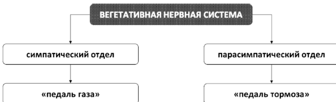
Рис. 2. Отделы вегетативной нервной системы