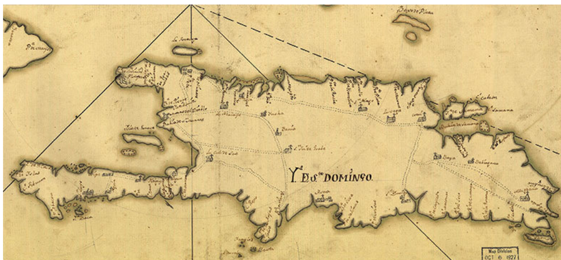
Карта острова Эспаньола (Гаити)

«Всякий, вступивший в общество буканьеров, должен был забыть все привычки и обычаи благоустроенного общества и даже отказаться от своего фамильного имени, – пишет И.-В. фон Архенгольц. – Для обозначения товарища всякому давали шутовское или серьезное прозвище, перешедшее у многих из них даже на потомков, если они вступали в брак. Другие только при брачном обряде объявляли свое настоящее имя: от этого произошла до сих пор сохранившаяся на Антильских островах поговорка, что “людей узнают только тогда, когда они женятся”».