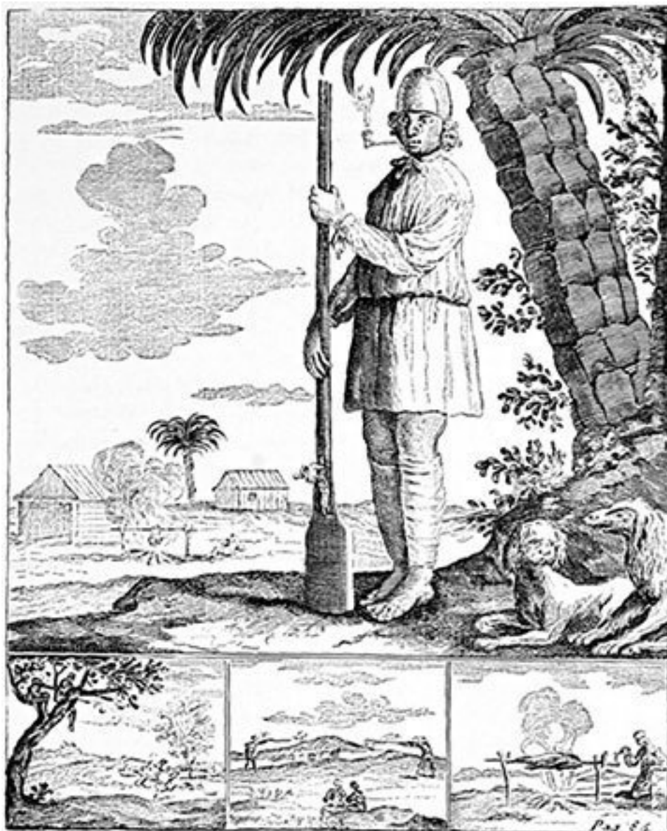
Буканьер. Гравюра из книги А. О. Эксквемелина «Пираты Америки»

У них нет никакого жилья или постоянного дома, а есть лишь места встреч, где располагаются их буканы, да несколько хижин на сваях, представляющих собой навесы, крытые листьями, для защиты их от дождя и хранения шкур убитых ими быков – до той поры, пока не придут какие-нибудь корабли, чтобы обменять их на вино, водку, полотно, оружие, порох, пули и некоторые другие вещи, в которых они нуждаются и которые составляют всё имущество буканьеров».