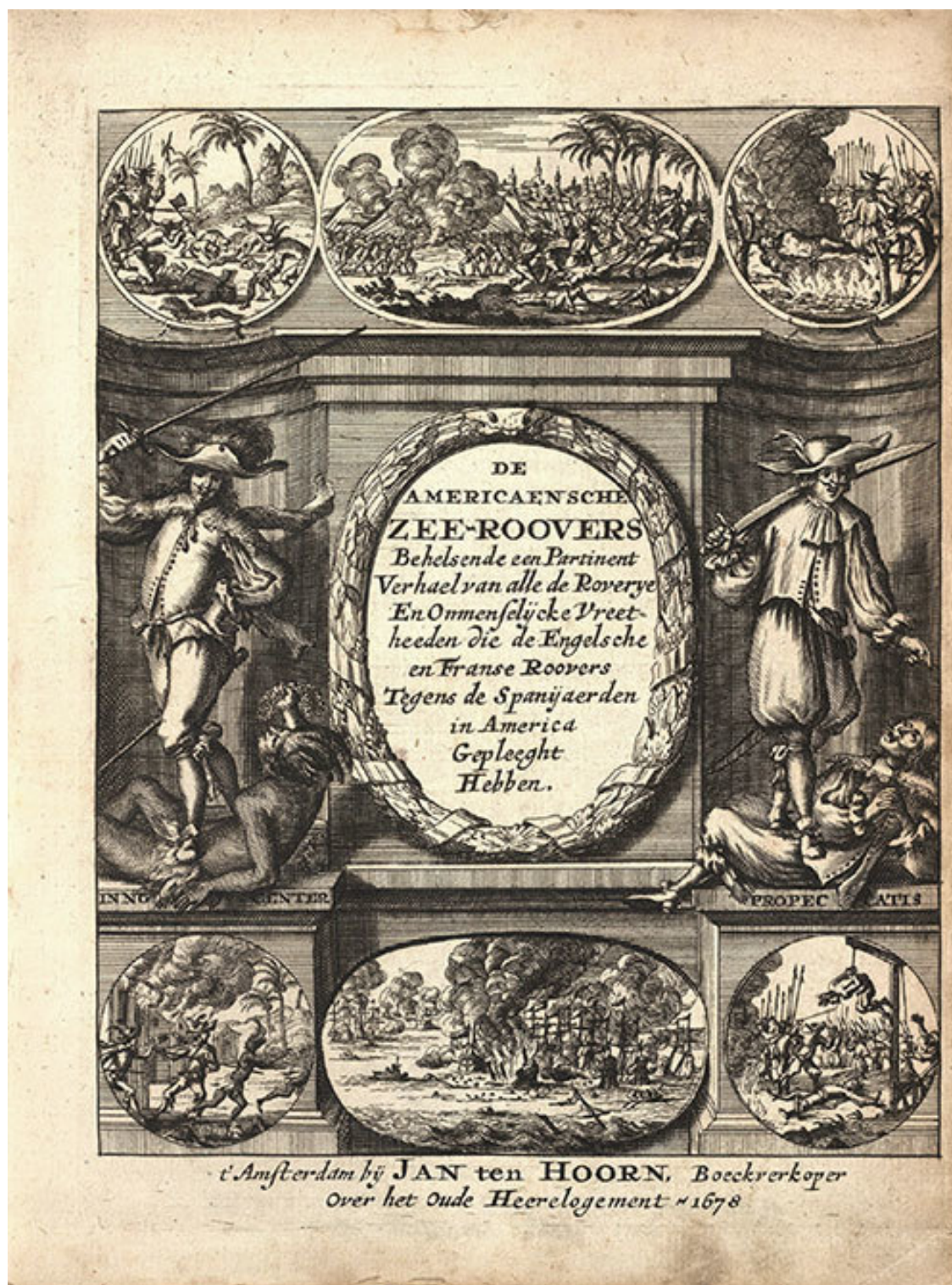
Титульный лист первого издания книги А. О. Эксквемелина «Пираты Америки»

Русскоязычная версия этой книги вышла в 1968 году. Хотя в предисловии к ее советскому изданию географ Я. М. Свет писал, что книга Эксквемелина «достоверна от первой до последней строки», столь категорический вывод нуждается в корректировке. Наряду с документально подтверждаемыми фактами в ней присутствуют и явно мифические сведения, кото-