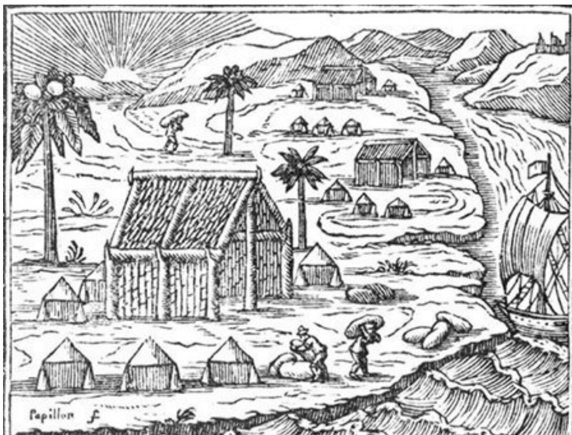
Жилище буканьеров. Французская гравюра конца XVII века

«Всякий, вступивший в общество буканьеров, должен был забыть все привычки и обычаи благоустроенного общества и даже отказаться от своего фамильного имени, – пишет И.-В. фон Архенгольц. – Для обозначения товарища всякому давали шутовское или серьезное прозвище, перешедшее у многих из них даже на потомков, если они вступали в брак. Другие только при брачном обряде объявляли свое настоящее имя: от этого произошла до сих пор сохранившаяся на Антильских островах поговорка, что “людей узнают только тогда, когда они женятся”».