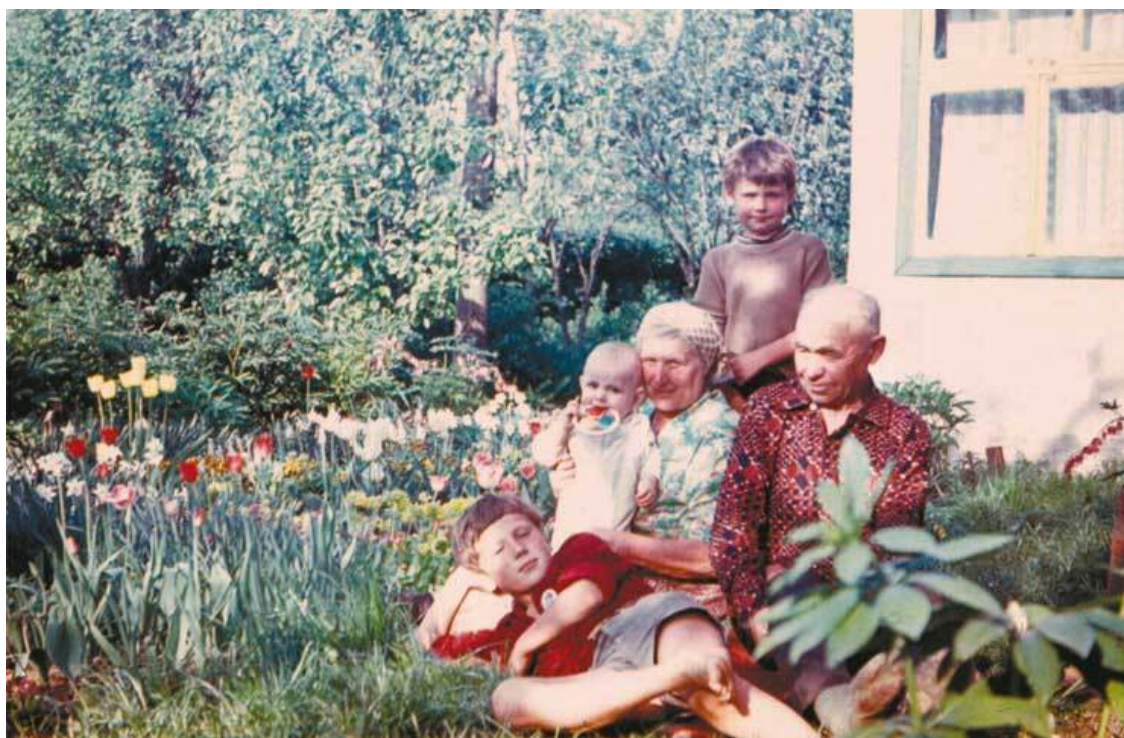
Моё самое первое лето у бабушки с дедушкой!