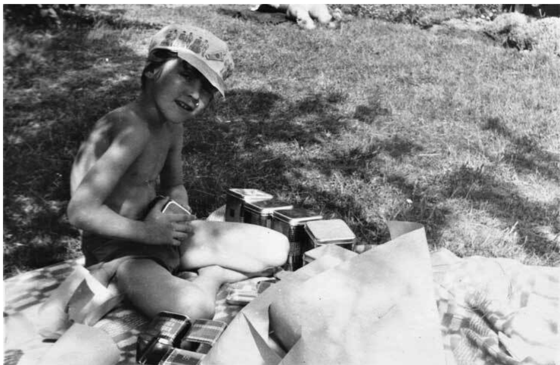
Я на даче. У меня уже сломан зуб от мопеда – это видно на фото