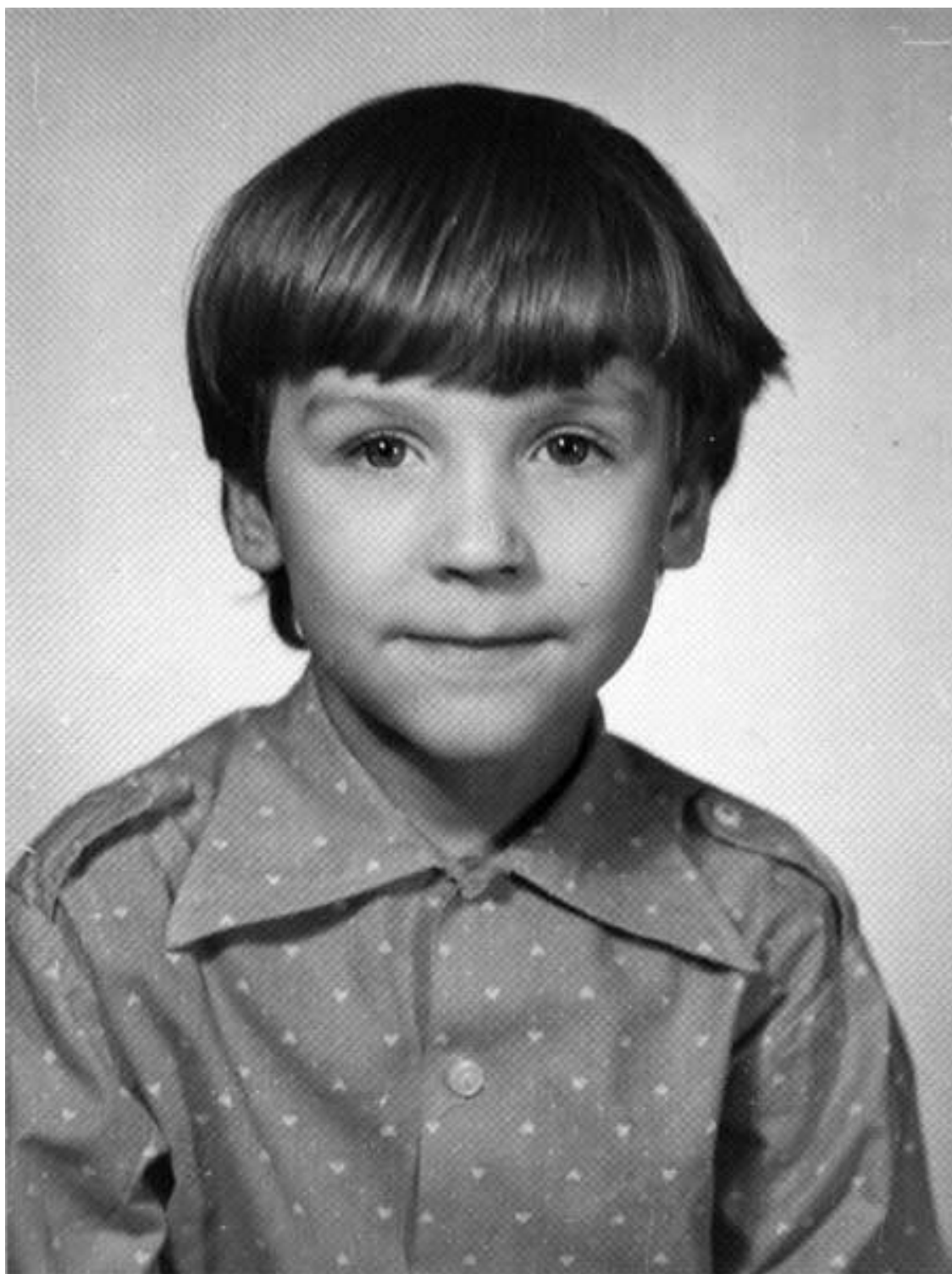
Я во втором классе, 1982 год