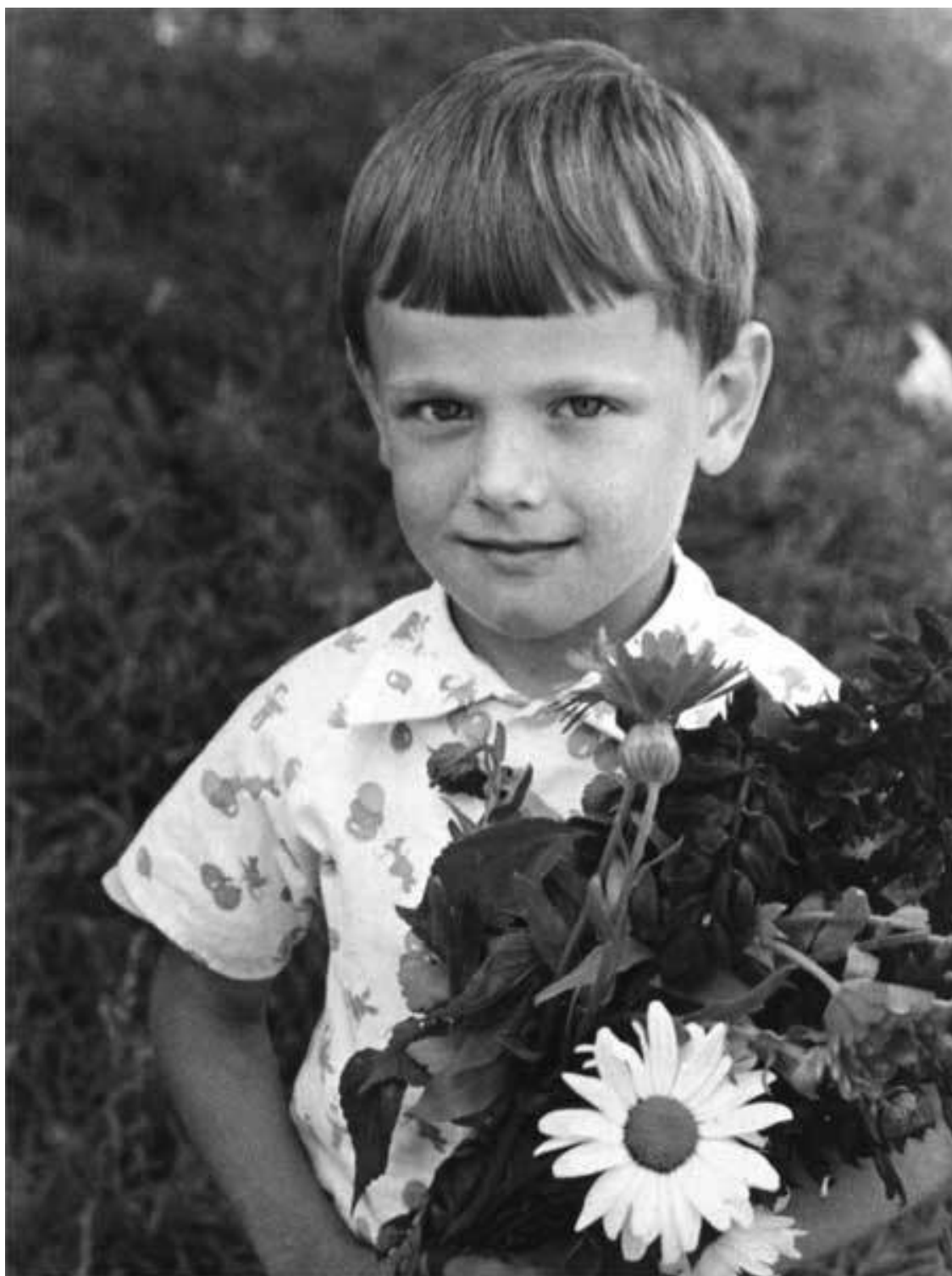
Старшая группа в 12-м детском саду, через год пойду в школу!