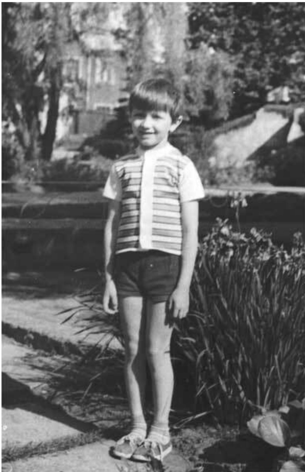
Мне 6 лет, пора заканчивать садик – видно, как я из рубашечки вырос!