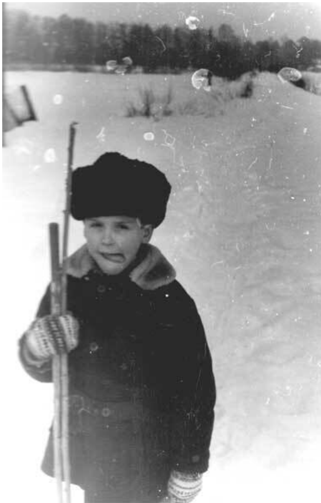
Зимний поход с отцом в районе дачи – наверное, первый класс

момент во мне стало расти острое переживание за несправедливость в мире, которую мы сами причиняем друг другу и природе. Это чувство до сих пор никуда не ушло.