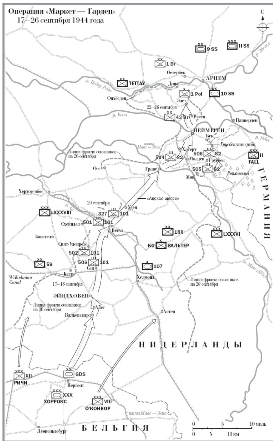
Операция «Маркет – Гарден». 17–26 сентября 1944 г.