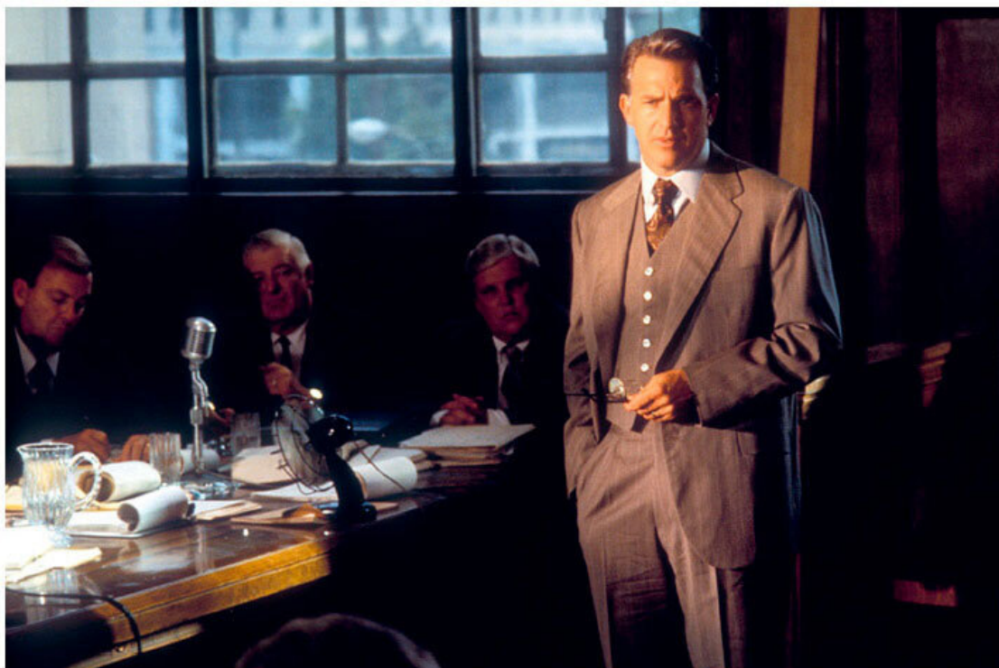
Джон Ф. Кеннеди: Выстрелы в Далласе 1991