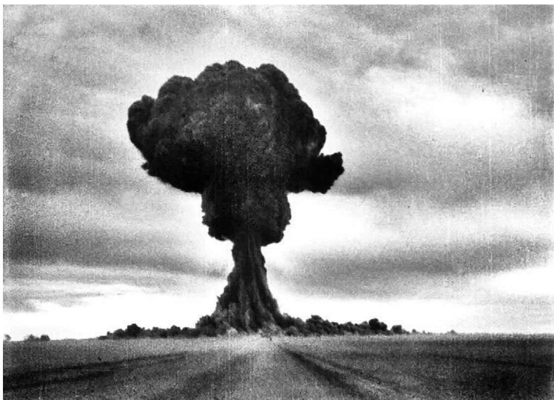
Конец американской атомной монополии. Окрестности Семипалатинска, 29 августа 1949 г.

передача неизвестному лицу в 1947 году секретной информации, касающейся атомной энергетики;