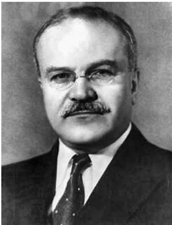
В. М. Молотов

В чем же причина такой радикальной, не имеющей прецедентов в истории Органов реформы? Тут нам придется ненадолго оставить Москву и обратить внимание на происходящее за океаном.