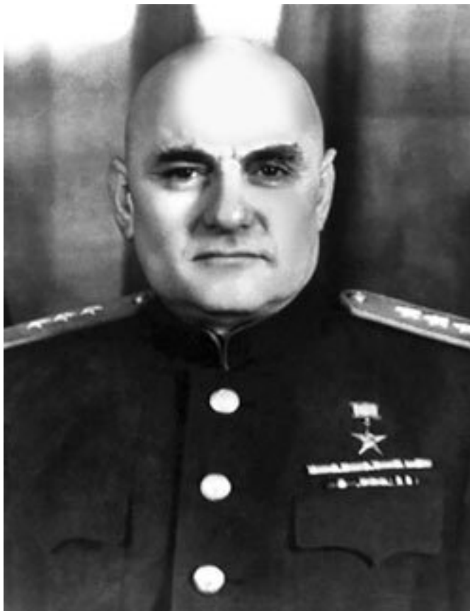
Б. Л. Ванников

присматривали чекисты – слишком много он знал. Инженер-теплотехник по образованию, он непродолжительное время проработал на производстве, а затем ушел на административную работу в аппарат СНК. Прекрасное техническое образование позволило ему легко разобраться в основах атомной физики. После создания Отдела «С» НКГБ-НКВД СССР он продолжал курировать переписку по «атомному проекту» Специального комитета СНК СССР с Лубянкой и «Аквариумом» (неофициальное название ГРУ).