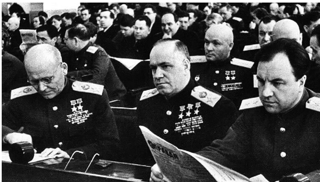
Маршалы Советского Союза И. С. Конеv и Г. К. Жуков и В. С. Абакумов. Кремль