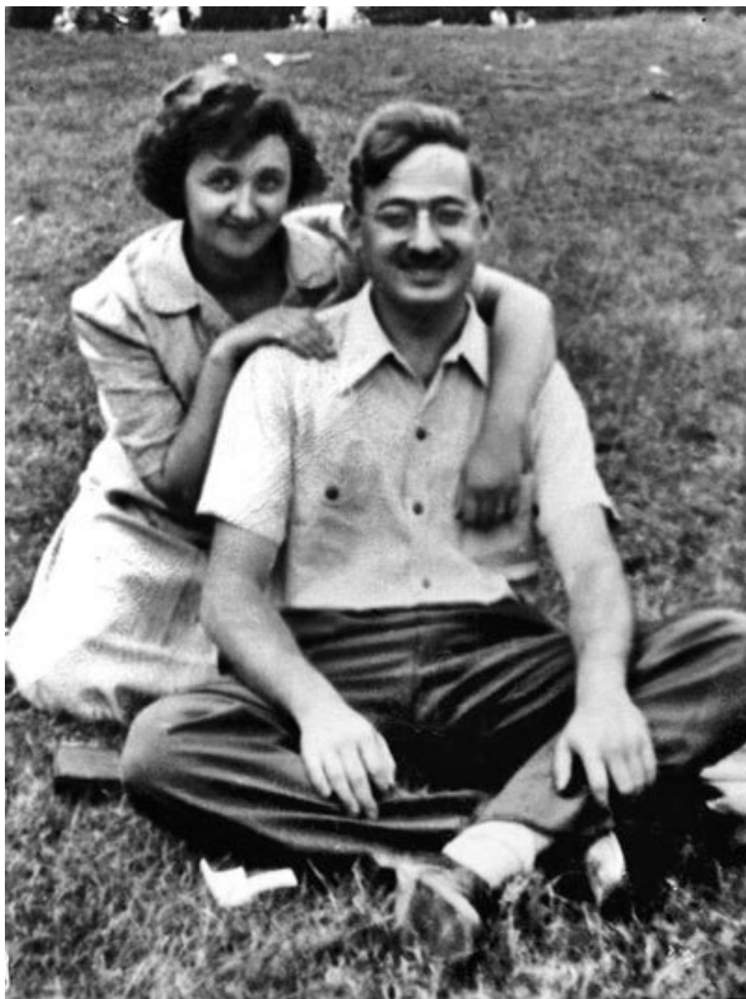
Юлиус и Этель Розенберг. Фото 1942 года

Мужественный был человек и убежденный коммунист. Он так и не признал себя виновным в участии в советском атомном шпионаже и тем самым не сохранил себе жизнь. А ведь мог. От него не требовалось кого-то предавать, кроме своих убеждений. Просто подтвердить уже известные следователям факты, выступить с покаянной речью на суде и отправиться отбывать наказание в одну из американских тюрем. Вопрос лишь в том, смог ли он бы жить после предательства самого себя? Скорее всего, нет.