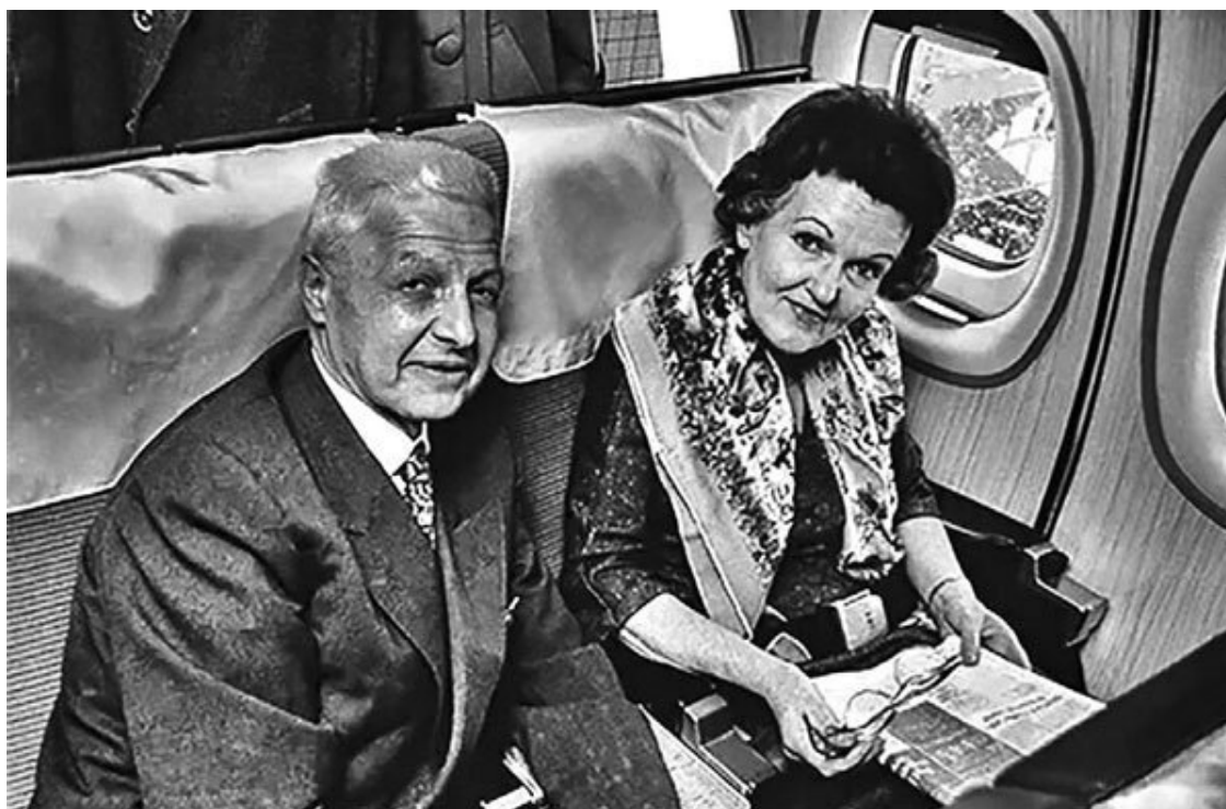
Герои России Морис и Леонтина Коэн