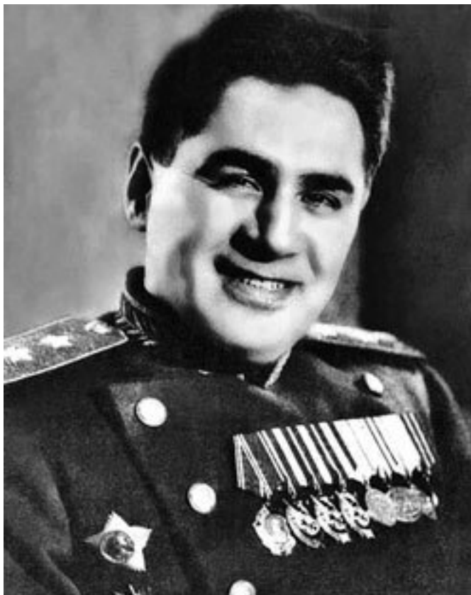
П. А. Судоплатов