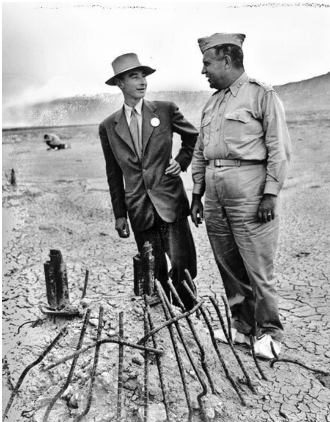
Начальник проекта «Манхэттен» генерал-майор Лесли Гровс и Роберт Оппенгеймер осматривают полигон «Тринити». Сентябрь 1945 г.

Тем временем ничего не подозревающий Фукс продолжал работать в Лос-Аламосе. В сентябре было решено, что члены британской научной миссии покинут США и продолжат свою работу в Англии. Фукс должен был вернуться в Англию в феврале следующего года. Поэтому во время его последней встречи с Голдом 19 сентября 1945 года он получил условия связи в Лондоне: Морнингтон-Кресент, первая суббота каждого месяца в 8 часов вечера. Однако по просьбе американцев Фукс задержался в США до июня. Все это время он вместе с Эдвардом Теллером работал над проблемами создания термоядерного оружия.