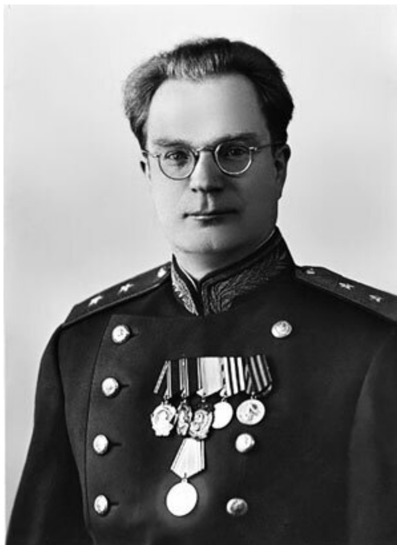
М. Г. Первухин

«По проблеме урана поступило большое количество технических материалов от НКГБ и Разведупра НКО. Для разборки этих материалов и переработки их в виде заданий для Лаборатории № 2 необходимо организовать специальное бюро в составе секретариата СНК СССР» 39 .