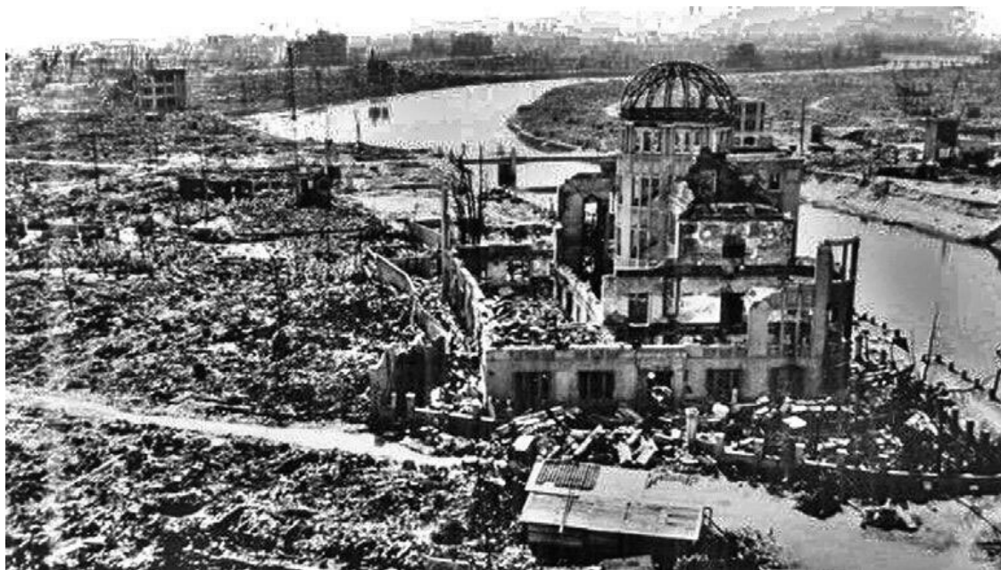
Атомный век начинается. Руины Хиросимы

В задачу Отдела «С» НКГБ-НКВД СССР входили работы, связанные со сбором, переводом, систематизацией и изучением материалов, относящихся к внутриатомной энергии и созданию ядерного оружия, в том числе документов, публикуемых в иностранной прессе и технической литературе, а также работах иностранных научных учреждений, предприятий и фирм, отдельных ученых и специалистов. Одновременно Отдел «С» стал одним из подразделений Специального комитета 38 по «проблеме № 1». Так звучит «официальная» версия рождения Отдела «С» НКГБ-НКВД СССР.