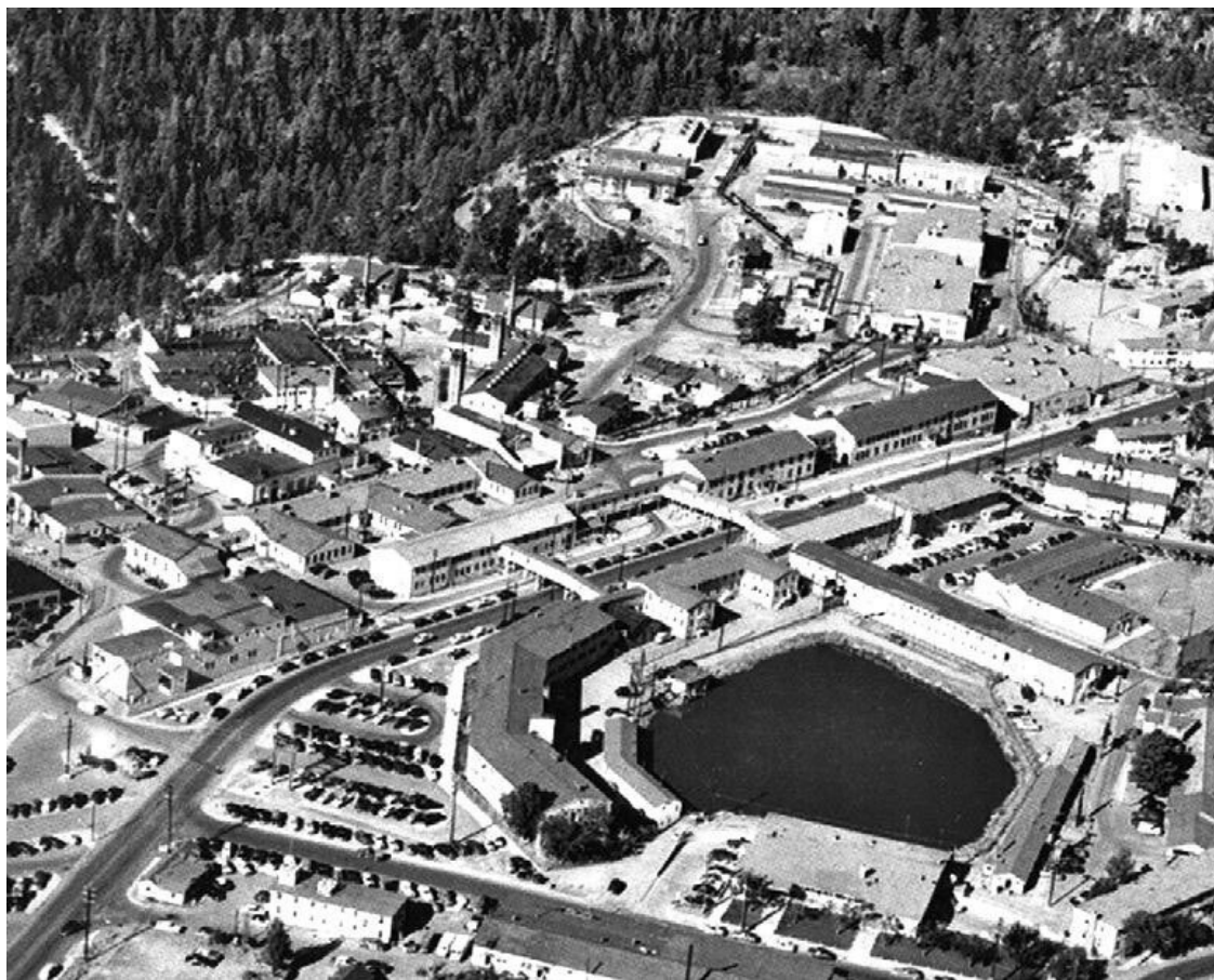
Вид с воздуха на Лос-Аламосскую национальную лабораторию