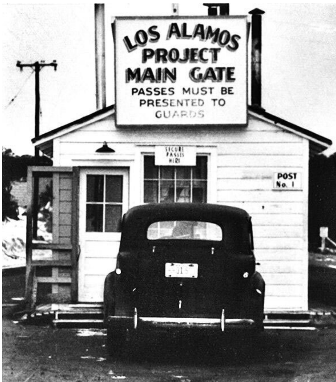
КПП на главном въезде в Лос-Аламосскую национальную лабораторию Департамента энергетики США