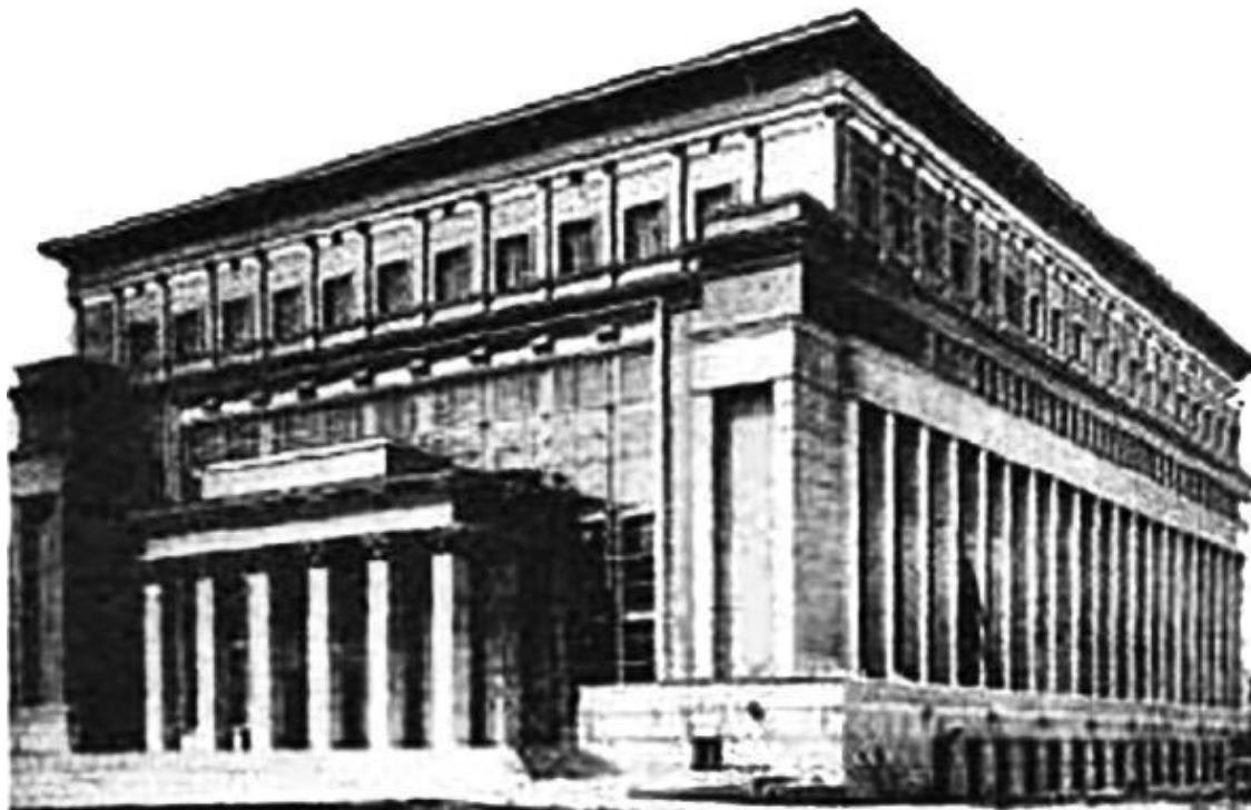
Здание Комитета информации в Ростокино

Analysis Branch – исследования и анализ) была передана во внешнеполитическое ведомство – Государственный департамент. Запомним этот момент! Затем 22 января 1946 г. президент США Г. Трумэн приказал создать на базе подразделения стратегических служб Центральную разведывательную группу, которая полтора года спустя и была преобразована в ЦРУ 3 .