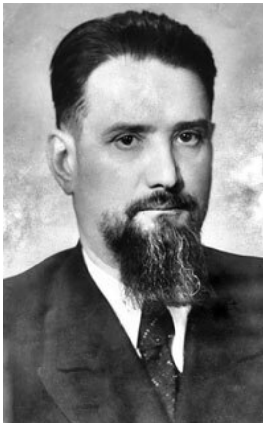
И. В. Курчатов

«Поручить тов. Берии принять меры к организации закордонной разведывательной работы по получению более полной технической и экономической информации об урановой промышленности и атомных бомбах, возложив на него руководство всей разведывательной работой в этой области, проводимой органами разведки (НКГБ, РУКА и др.)».