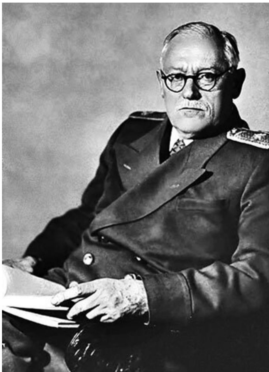
А. Я. Вышинский