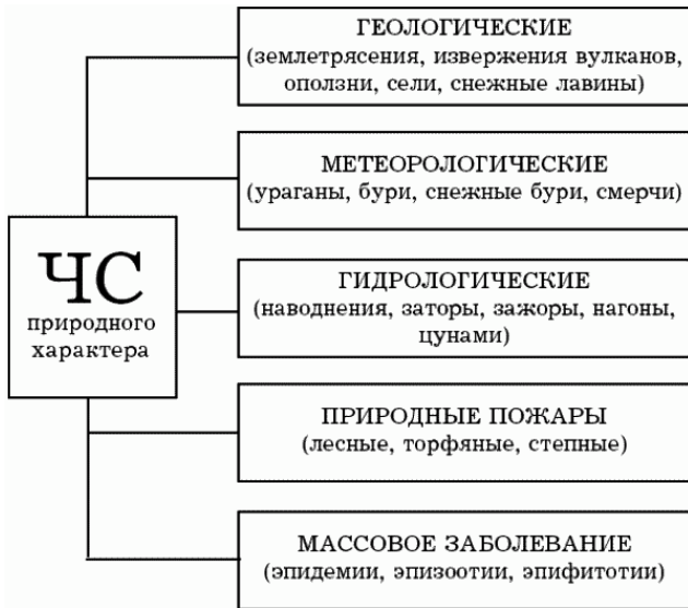
Рис. 1. Классификация ЧС природного характера