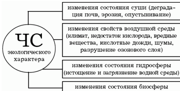
Рис. 3. Классификация ЧС экологического характера