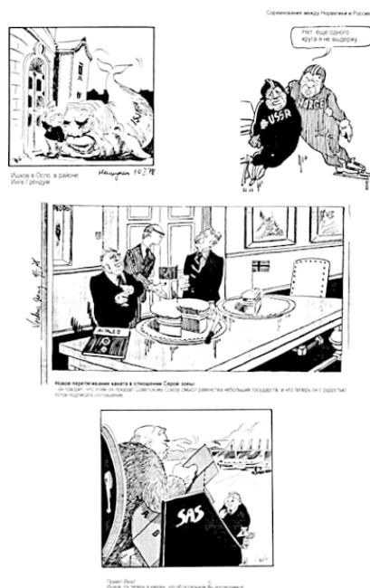
Рис. 2. Коллажи из норвежских газет на ход и результаты переговоров между министром СССР А. Ишковым и министром Норвегии Е. Эвенсоном в 1978 г. по «смежному участку» – «серой зоне».

Были в ходе переговоров и неожиданные довольно серьезные сложности. Одна из них – это требование норвежской стороны о специальном заявлении, в котором подчеркивалось обязательство советской стороны о необходимости окончательного разграничения 200-мильных зон в Баренцевом море. Поскольку это не было оговорено ранее в директивах делегации, то А. Ишкову пришлось согласовывать текст напрямую по телефону (переговоры завершались в Осло) с министром иностранных дел А. Громыко. Полагаю, что только благодаря давним дружеским отношениям между ними удалось найти устраивающую как советскую, так и норвежскую сторону формулировку. А завершающий аккорд договоренности обозначился казусом. Когда делегация разошлась после подписания и соответствующего приема от имени Правительства Норвегии, наша делегация, проверяя набор документов, обнаружила, что на одном из них (русский текст) отсутствует подпись главы норвежской делегации Е. Эвенсена. Срочно пришлось уже поздно ночью выезжать к нему домой, да так, чтобы пресса не обнаружила, и подписать этот документ. Мне была поручена эта курьезная миссия и впоследствии каждый раз при встрече с Е. Эвенсоном он, хитро прищуриваясь, шутил: «Надеюсь, вы прессе ничего не сказали?». В ответ я говорил: «А вы?»