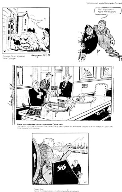
Рис. 2. Коллажи из норвежских газет на ход и результаты переговоров между министром СССР А. Ишковым и министром Норвегии Е. Эвенсоном в 1978 г. по «смежному участку» – «серой зоне».

нему домой, да так, чтобы пресса не обнаружила, и подписать этот документ. Мне была поручена эта курьезная миссия и впоследствии каждый раз при встрече с Е. Эвенсоном он, хитро прищуриваясь, шутил: «Надеюсь, вы прессе ничего не сказали?». В ответ я говорил: «А вы?»