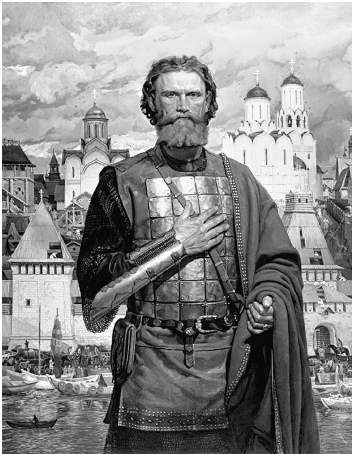
Дмитрий Донской. Художник В. Маторин

У пристаней колыхались десятки судов. Москва стояла на перекрестке. Если плыть по Яузе, попадешь к Мытищинскому волоку, таможенники проверят товары («мыт» как раз и означало «пошлина»), а местные мужики подработают, перетащат ладью на Клязьму – и отправляйся по ней к Владимиру или еще дальше: на Оку, Волгу, в Камскую Болгарию, Сарай. На Оку и Волгу можно было попасть другой дорогой, спуститься по Москве-реке к Коломне. А если свернуть с Оки на Проню, через волок суда выходили на Дон. Плыли к Азовскому морю, крымским берегам, в шумные венецианские и генуэзские колонии.