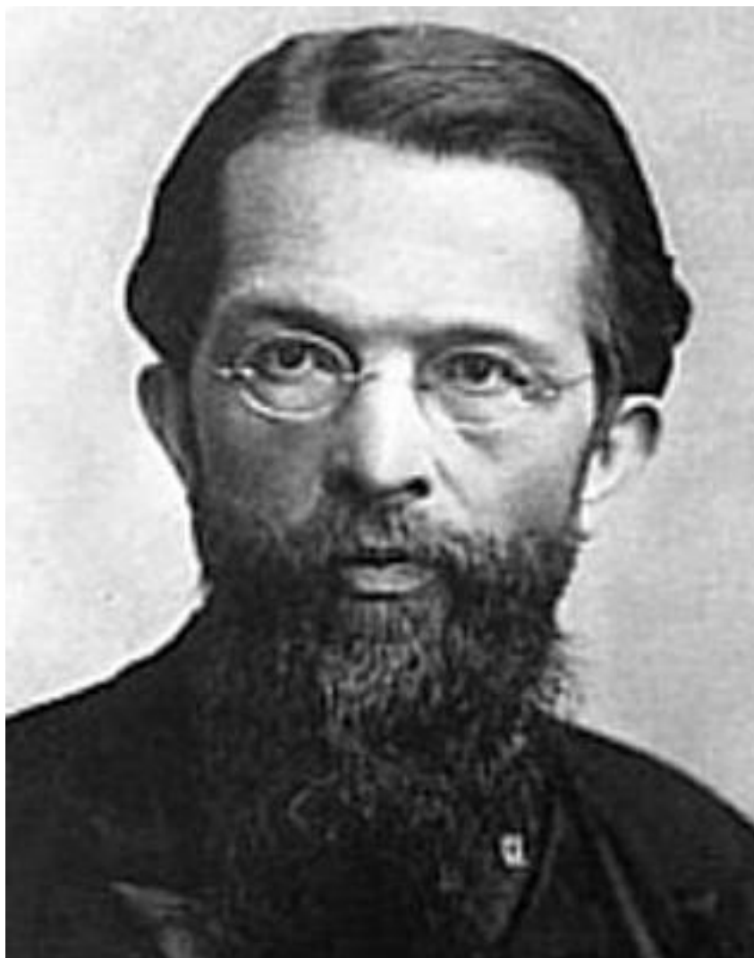
Карл Менгер проф., Австрия 1840–1921 гг.