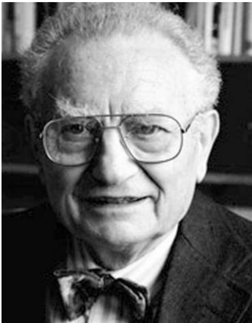
Пол Энтони Самуэльсон проф., Нобелевский лауреат, США 1915–2009 гг.