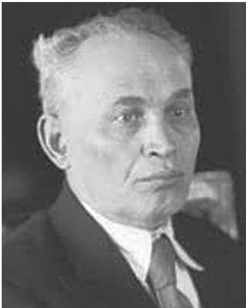
Розенберг Давид Иохелевич, д. э.н., член-корр. АН СССР, Россия 1879–1950 гг.