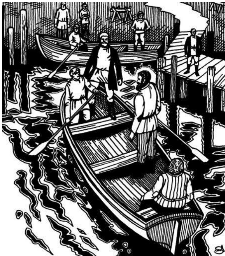
Иллюстрации Даниил Селевёрстов