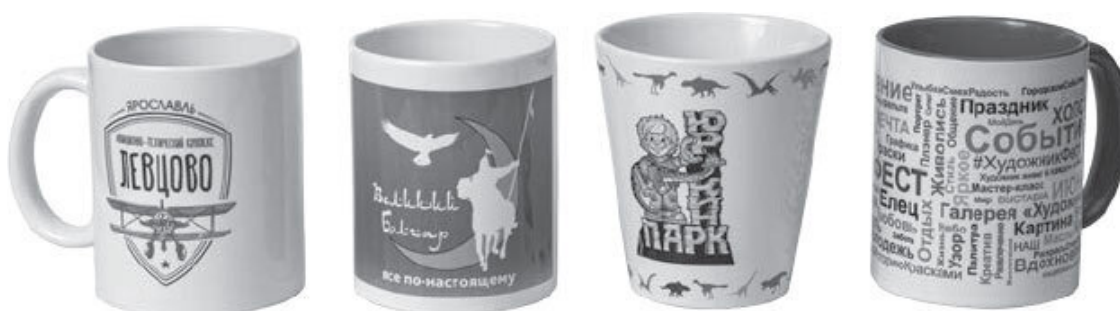
Набор кружек