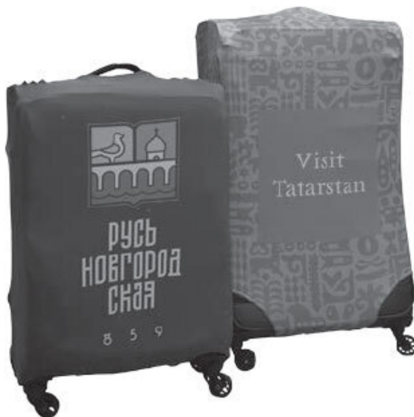
Чехлы на чемодан

Сувенирные кружки, термосы, подстаканники и другие элементы посуды многие производители сувенирной продукции стали брендировать в качестве изделий для туристов.