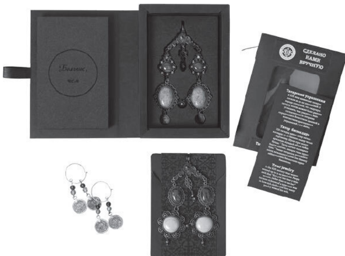
Татарские украшения

Далее приводятся ответы наших экспертов, а также представителей отечественной туриндустрии и рынка туристической сувенирной продукции на вопрос «Является ли функциональность туристического сувенира приоритетным фактором при его выборе и приобретении?».