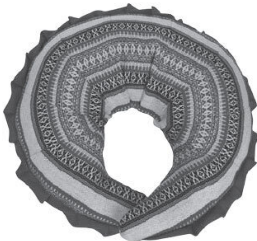
Подушка «Пельмень»