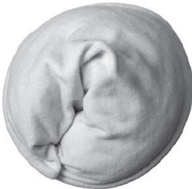
Дорожная подушка «Пельмень»