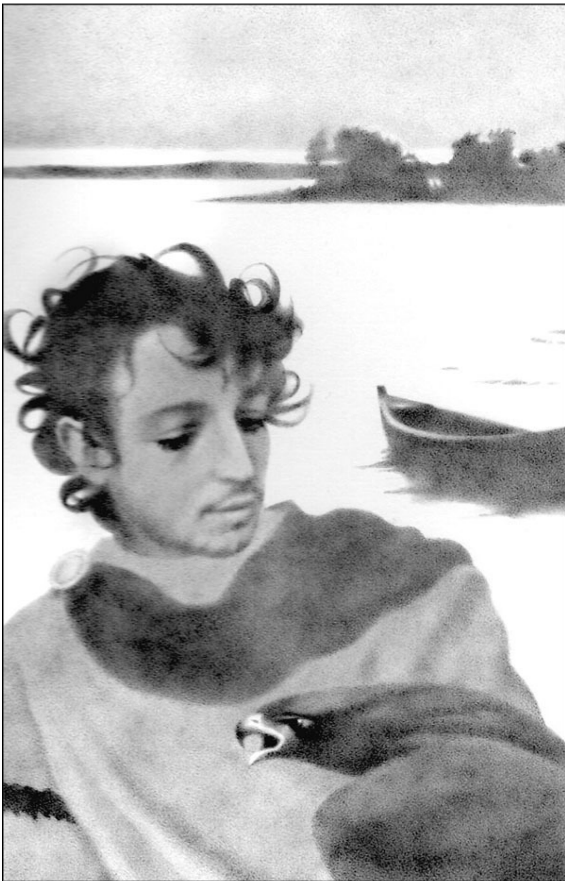
Юноша с орлом