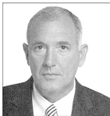
Рис. 1. Обратите внимание на черты лица человека, когда он не испытывает стресса. Веки должны быть расслабленны-

Заповедь 5. Когда вы общаетесь с другими людьми, то старайтесь определить их базовые модели поведения. Для того чтобы выявить базовые модели поведения у людей, с которыми вы общаетесь регулярно, вам придется понаблюдать за тем, как они обычно выглядят, как сидят, куда кладут руки, как ставят ноги, какую предпочитают позу, какую используют мимику, как наклоняют голову и даже куда они обычно кладут свои вещи, такие, например, как кошелек (см. рис. 1 и 2). Вам нужно будет научиться отличать их «нормальное» выражение лица от «напряженного».