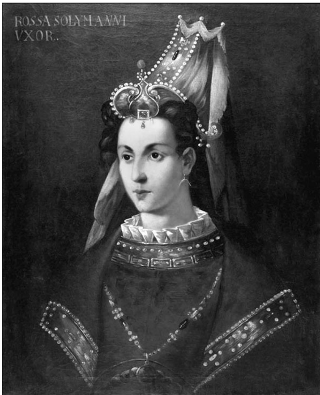
Один из портретов Роксоланы

Казалось бы, судьба прекрасной наложницы предначертана: девушка проведет всю свою жизнь в гареме как невольница для услады повелителя, но все сложилось по-другому. После того, как девушка приняла ислам, она получила имя Хюррем. Ее природная красота, необыкновенная мудрость помогли из простой наложницы стать единственной горячо любимой женой Сулеймана Великолепного. Так Хюррем начала вершить настоящую большую Историю великого государства.