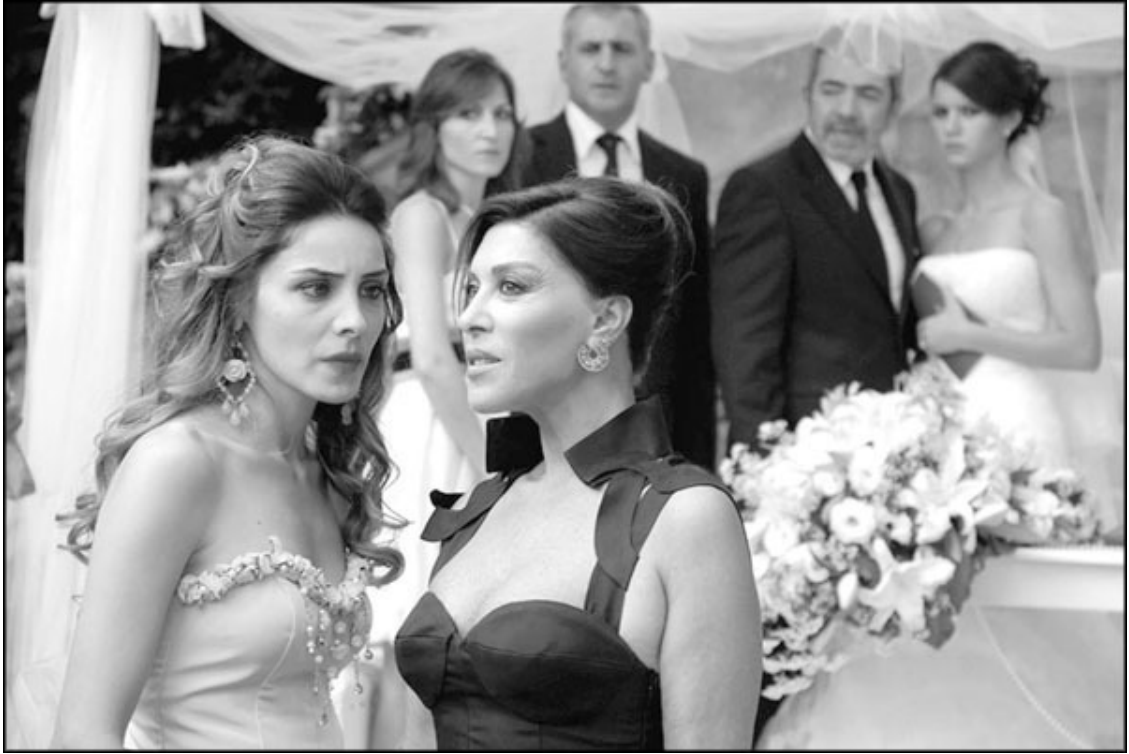
Кадр из сериала «Запретная любовь»

Понятно, что все эти фильмы могут менять свои места в условной ТОП-Ю в зависимости от вкусов и пристрастий зрителей, но все сходятся во мнении, что лишь один сериал неизменно остается на своем месте под номером 1. И это, без сомнения, сериал «Великолепный век».