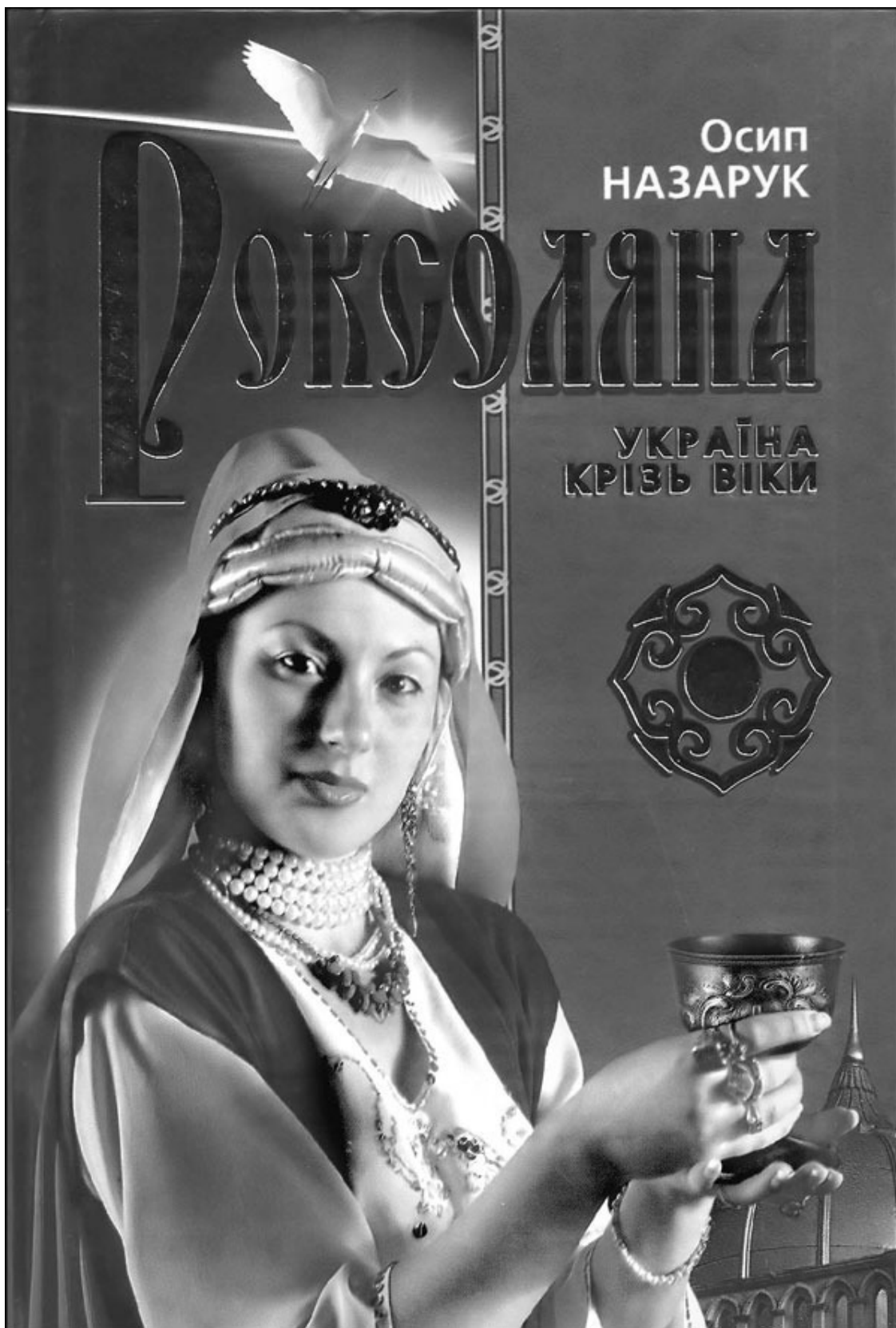
Историческая повесть Осипа Назарука

В хрестоматиях украинской литературы правдиво указывается, что «Писатель изобразил Роксолану как национальную героиню, которая сконденсировала в своем характере наиболее существенные черты национального сознания». Но с таким же успехом любой талантливый