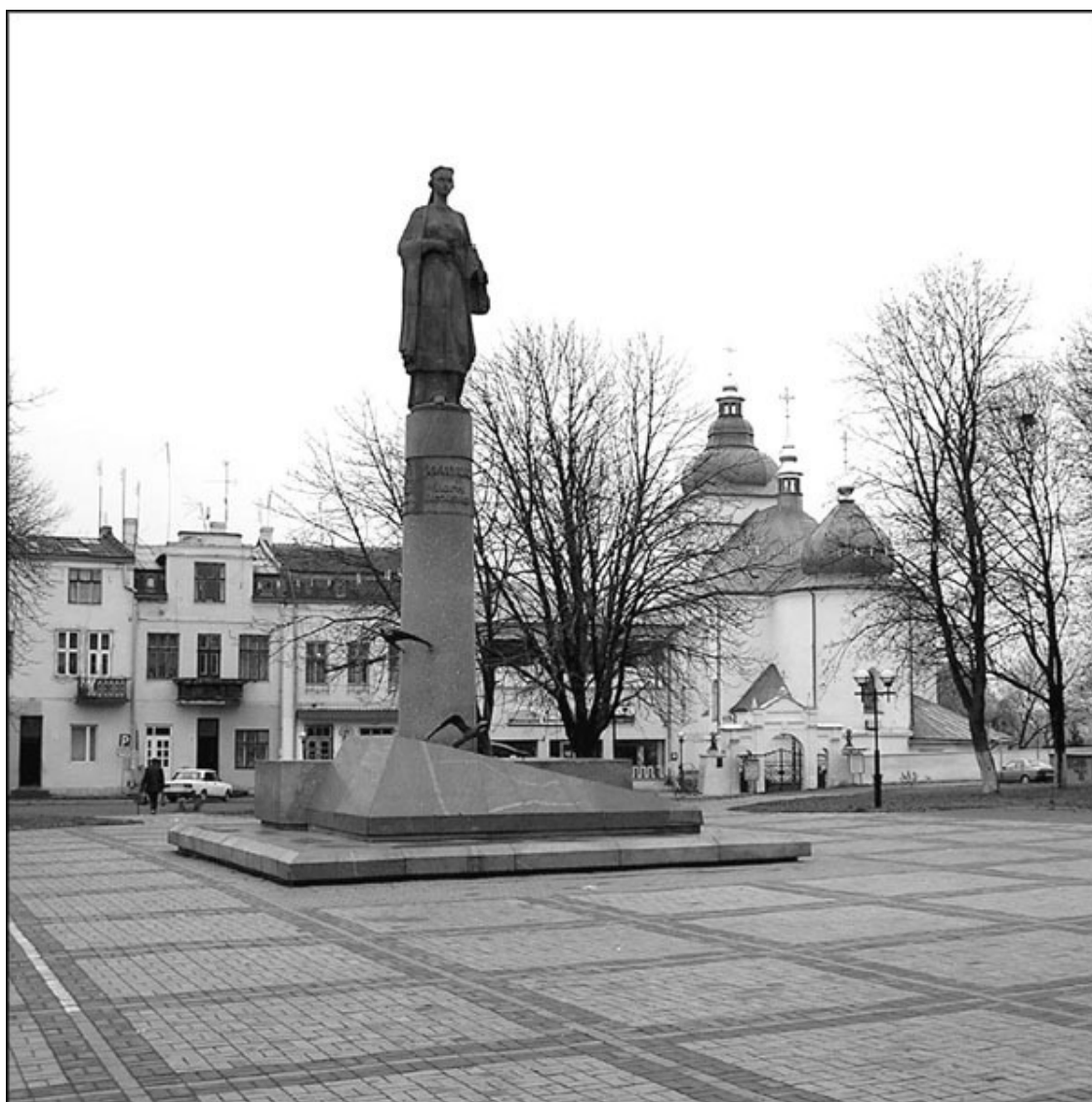
Памятник Роксолане в Рогатине

Не так уж давно творческая общественность Хмельницкой области (Украина) проводили мероприятия в связи с 500-летием со дня рождения знаменитой Роксоланы. Отмечая вместе со всем миром эту круглую дату, несколько тихих городков считали, что будущая султанская жена родилась в 1505 году именно в их «пенатах». На звание родного городка Роксоланы-Хюррем претендовали как минимум двое: Чемеривцы и Рогатин. При этом сам городок Чемеривцы появился только в 1565 году.