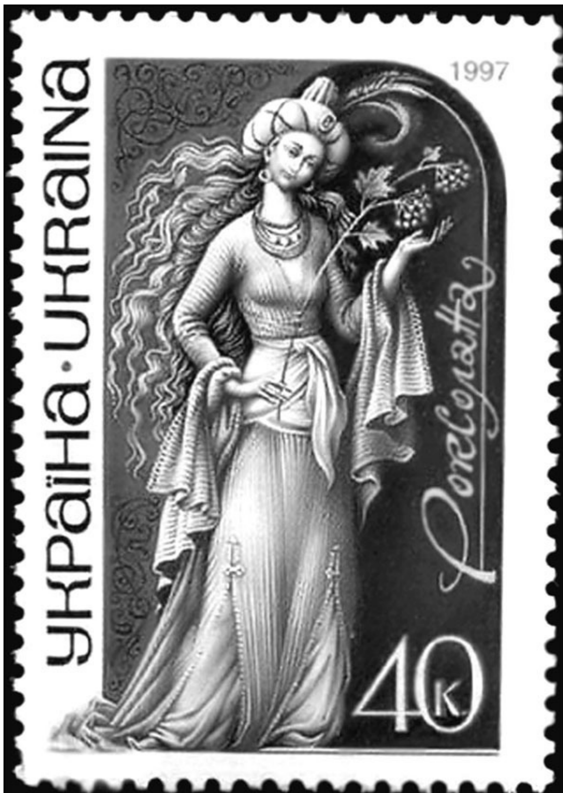
Марка, посвященная Роксолане

И если с местом обитания «королевы Османской империи» все обстоит не совсем ясно, то вопрос о том, как незабвенная и странная Анастасия, она же Александра Гавриловна Лисовская стала Роксоланой, имеет простое объяснение: венецианские послы-баилы в своем донесении из Стамбула называли ее Роксоланой, – потому что именно так на латыни звали русских людей.