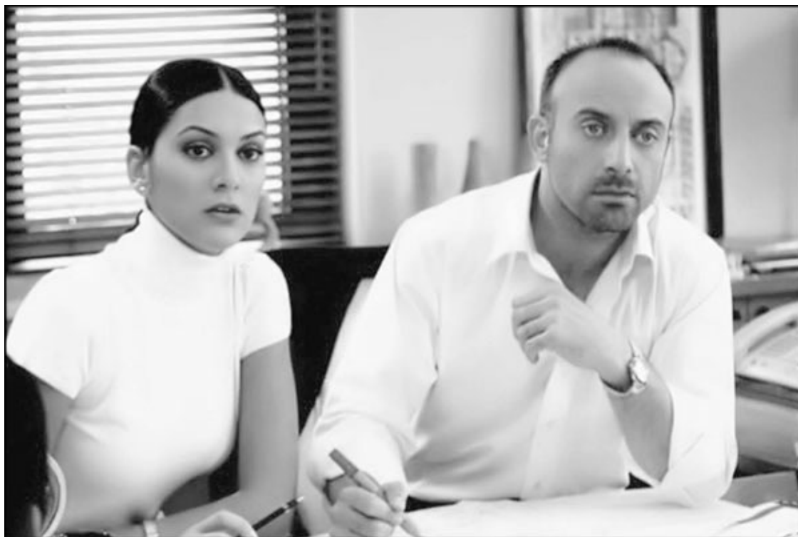
Кадр из сериала «Тысяча и одна ночь»

Сюжет: Современное проникновение в историю Османской империи на фоне личных взаимоотношений, интриг и любовных драм в кулуарах восточных дворцов. В центре сериала султан Сулейман Великолепный – властный, жесткий, но идеально справедливый и человек, активный завоеватель, могущественный правитель, держащий в страхе другие государства. Ему была подарена наложница Александра (Роксолана), которой удалось завоевать внимание, а затем и страстную любовь султана благодаря своей женской хитрости, мудрости и уловкам. Рыжеволосая красавица приняла ислам и получила от султана в награду имя Хюррем («счастливая; веселая; дарящая радость и веселье»). Нелегко было Хюррем выживать в гареме: в окружении султана были еще его властная мать, ревнивая первая жена с сыном-наследником, а также большой гарем наложниц. Но Хюррем превзошла всех, когда добилась невозможного: она стала правительницей султаната. Весомый плюс сериалу добавляют роскошные интерьеры, необычайно красивые костюмы, ненавязчивая восточная музыка, а самое главное – неподражаемый актерский состав. Осталось только поближе познакомиться со знаковыми фигурами любимого сериала.