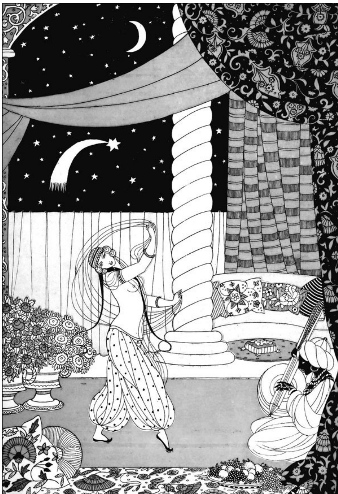
Рисунок Миссь (Ремизова А.В.), начало XX века