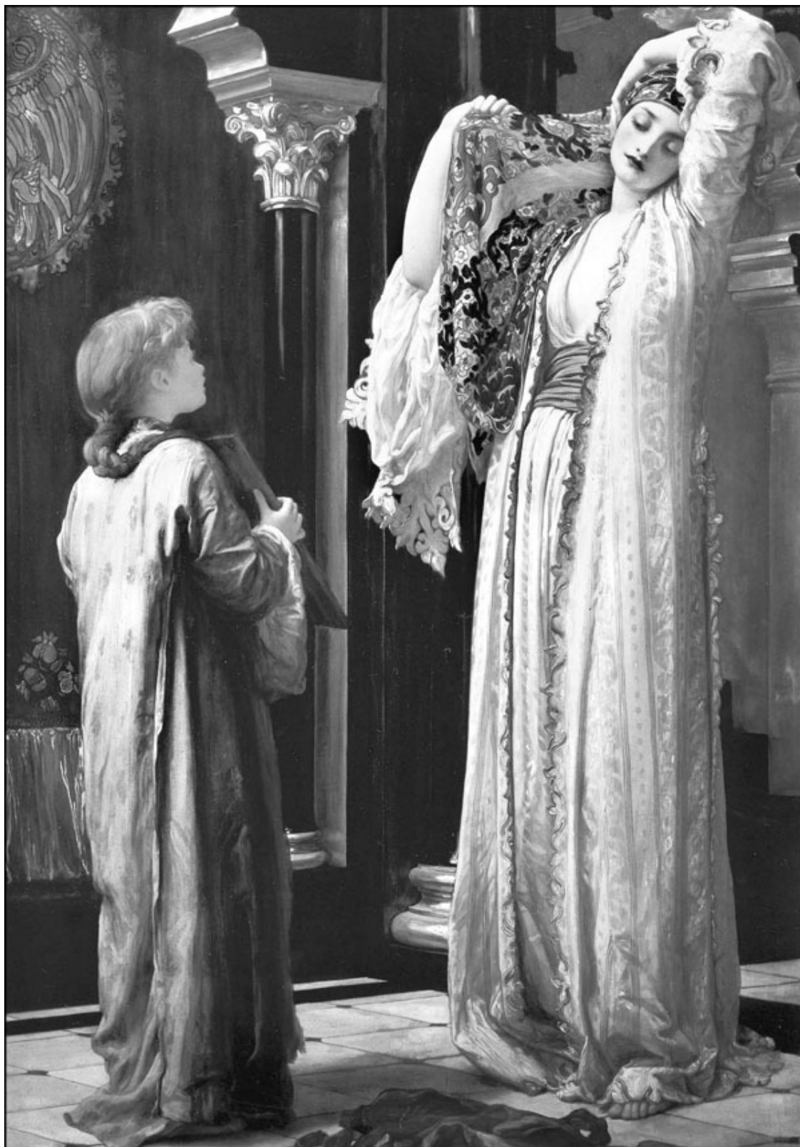
Свет гарема. Художник Лорд Фредерик Лейтон

Синам-ага шагнул к темной фигуре и сорвал покрывало. Буйно потекло из-под черного шелка слепящее золото, ударило таким неистовым сиянием, что даже опытный Луиджи, которого трудно было чем-либо удивить, охнул и отступил от девушки, зато Ибрагима непостижимая сила как бы кинула к тем дивным волосам, он даже нагнулся над девушкой, уловил тонкий аромат, струившийся от нее (заботы опытного Синам-аги), ему передалась тревога