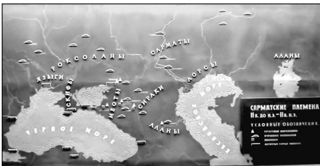
Карта расселения сарматских племен

Великий ученый М.В. Ломоносов утверждал, что историки должны отождествлять роксолан с росами/русами. Он утверждал, что варяги-россы в древности назывались роксоланами или россоланами (так как россы были соединены с аланами), причем наиболее правильным он считал название россоланы, так как роксоланы являлось искажением, введенным греками.